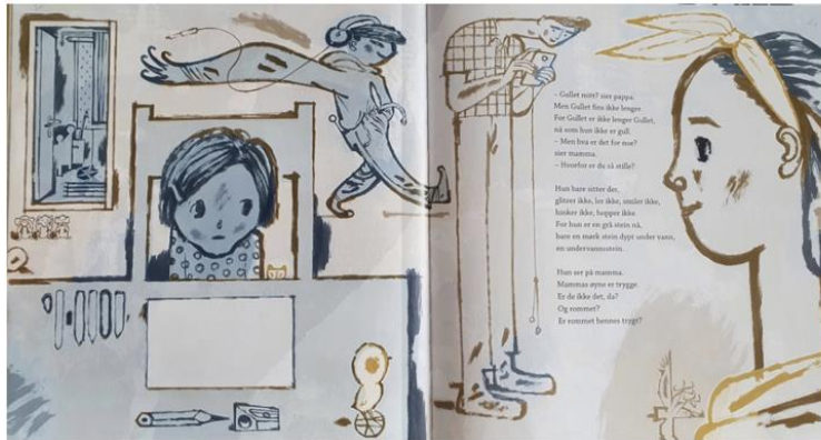
Dahle, 2016, Oppslag 10