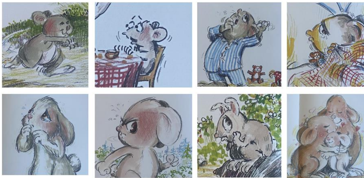
Siggerud, 2021, utklipp fra oppslag 1, 2, 3, 4, 5, 6, 7 og 11

Illustrasjonene skaper blikkfang med sine sterke farger og lystige illustrasjoner. Det er mye følelser i illustrasjonene, og man ser at dette er noe illustratøren har lagt vekt på. Følelsene kommer til uttrykk gjennom ansiktsuttrykk, blick og kroppsspråk. Ansiktsuttrykket til Småen endrer seg konstant fra oppslag til oppslag. På det første oppslaget er Småen glad. Han smiler og hopper bortover stien og er på vei hjem for å spise med mamma og pappa. På det andre oppslaget ser vi derimot en annen side av Småen. Han har et redd og fortvilet ansiktsuttrykk, med tårer som presser på i øynene. Han har fått beskjed fra mamma og pappa, om at de skal bort i kveld, og at Haren kommer for å passe på. Det er tydelig at Haren er en som Småen har god kjennskap til. Det skapes et tomrom, da vi ikke får vite hvorfor Småen er redd og trist. Dette tomrommet bidrar til å skape spenning i historien. Tomrommet i teksten, må fylles ut av leseren. Hvordan leseren tolker dette tomrommet, vil variere fra person til person, da hver enkelt fyller tomrommet med sine egen erfaringer og opplevelser.