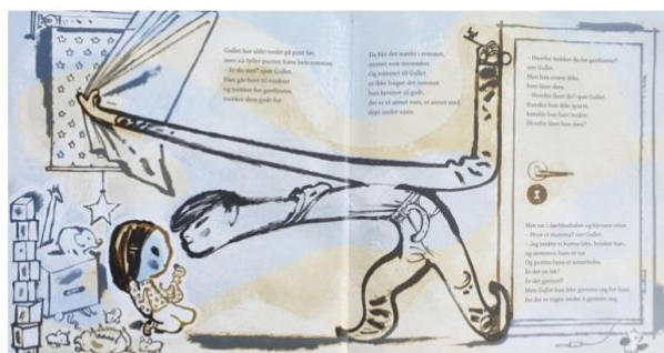
Dahle, 2016, Oppslag 4

Når broren kommer inn på rommet i oppslag 4, trekker gardinene godt for og låser døra, endrer stemningen seg og alle dyrene gjemmer seg. Det samme gjør de i oppslag 5. Dyrene gjemmer seg bak Gullet.