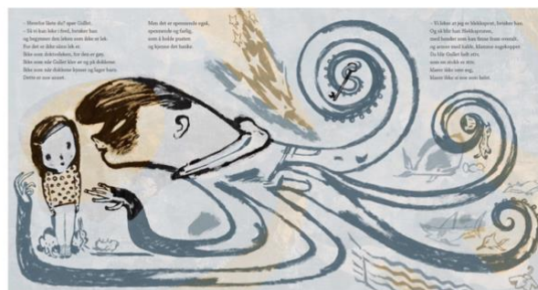
Dahle, 2016, Oppslag 5

Dyrene er med på å forsterke den stemningen som er i de ulike oppslagene. Etter overgrepet, begynner dyrene og sakte komme frem igjen, men vi ser videre i oppslagene at de, i likhet med Gullet, fortsatt er redde. De er mindre synlige i oppslagene fra overgrepet skjedde og frem til oppslag 15. Her har Gullet fortalt mamma og pappa om den vonde hemmeligheten, og mamma forsøker å fikse det som nesten ikke kan fikses. Vi ser at Gullet begynner å lyse igjen, hun føler seg tryggere. Det samme gjør kosedyrene. Mange av kosedyrene er i nærheten av mammaen til Gullet, der det er trygt. Vi ser også flere mammadyr sammen med barna sine. Vi ser en ku med en kalv og en hund med tre små valper. Dette tolker jeg som et symbol på trygghet. På oppslag 16 leker Gullet med kosedyrene sine igjen.