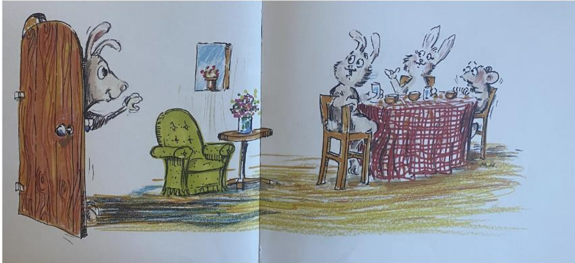
Siggerud, 2021, utklipp fra oppslag 2

I Ikke tull med Småen blir handlingen lagt til en kanin/harefamilie, i tillegg til at vi møter noen andre dyr i illustrasjonene og verbalteksten. I verbalteksten blir familien formidlet som en helt vanlig menneskelig familie, men blir framstilt som en kanin/harefamilie i illustrasjonene. Første møtet med familien er når de sitter og spiser middag, som en helt ordinær menneskelig familie.