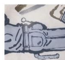
Dahle, 2016, utklipp fra oppslag 8, 9, 10, 11, 14