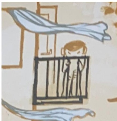
Dahle, 2016, nærbilde oppslag 15 og 17

Disse illustrasjonene åpner opp for diskusjon om hva som skjer med en overgriper i etterkant av et overgrep. Jeg tolker det som at han har fått en del restriksjoner, og blir passet godt på, da han fortsatt bor hjemme, sammen med Gullet og resten av familien. Hjemmet er preget av en dus blåfarge, og selv om hemmeligheten er fortalt, er det fortsatt en nokså dyster stemning i huset. Utenfor huset er det derimot en trygg og god stemning. Det lyser gult overalt og barn og voksne smiler og ler. Jeg vil si at boken har en åpen slutt. Det er rom for tolkning og refleksjon, når det gjelder hva som skjer videre i familien.