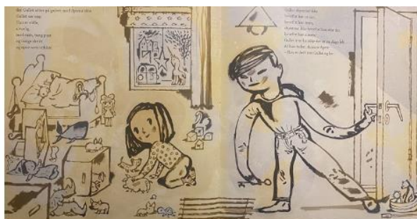
Dahle, 2016, Oppslag 3

Når broren kommer inn på rommet i oppslag 4, trekker gardinene godt for og låser døra, endrer stemningen seg og alle dyrene gjemmer seg. Det samme gjør de i oppslag 5. Dyrene gjemmer seg bak Gullet.