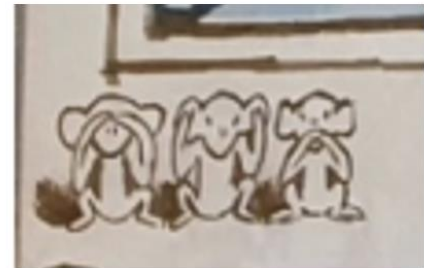
Dahle, 2016, nærbilde oppslag 10

Jeg tror at apene kan symbolisere de ulike karakterene i boka. Jeg kobler apen, som ikke ser noe ondt, til moren. Hun har ikke sett det som har skjedd, men forsøker å få kontakt med Gullet for å finne ut hvorfor hun ikke er som seg selv. Hun forsøker å finne ut hva som har skjedd. Apen som holder for ørene, tror jeg symboliserer faren. Han sier «Gullet mitt?» (oppslag 10), men har hodet godt plantet ned i telefonen, noe som tyder på at han egentlig ikke vil høre hva hun har å si. Den siste apen, den som holder seg for munnen, kobler jeg mot Gullet. Gullet har en hemmelighet hun ønsker å fortelle, men hun er redd. Redd for om blekkspruten finner ut av det, redd for at mamma ikke tror på det og at hun tror alt er tull.