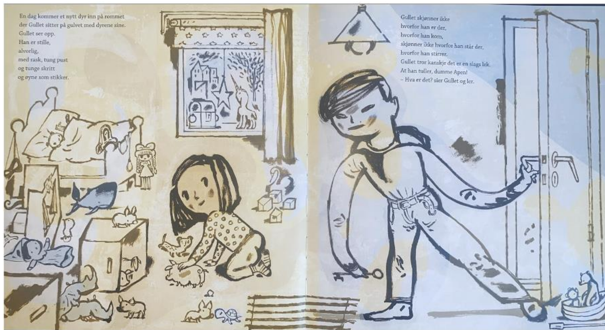
Dahle, 2016, Oppslag 3

Ifølge Birkeland et al. (2018, s. 177) sin liste over vanlige tolkninger av farger i vår kultur, er blå og gul to farger med store kontraster. Fargene symboliserer kontraster mellom det melankolske, maskuline og dystre og det lette, optimistiske og håpefulle. I Blekkspruten merker vi godt at denne kontrasten og fargene kjemper om å være den dominerende fargen, som vi kan se i det første oppslaget. Fra starten av boken, på de første oppslagene, er bakgrunnen for det meste gul, med unntak av broren og elementer rundt han. Når Gullet sitter på rommet sitt og leker på oppslag 3, er rommet fylt av lyset hun utstråler, altså gulfargen. Hun er gul, klærne er gule, de fleste kosedyrene, senga og rommet er gult. Vi ser derimot at broren kommer inn på rommet. Han er blå og tar med seg en dus pastellblå farge inn på rommet hennes.