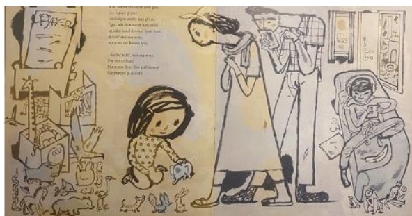
Dahle, 2016, Oppslag 1

På nesten hvert eneste oppslag i bildeboka, ser vi mange små kosedyr. Ser vi på første oppslag finner vi blant annet aper, strutser, ørner, kyllinger, kaniner og slanger. Vi ser altså mange av dyrene som brukes i verbalteksten også i illustrasjonen. Hvordan dyrene i illustrasjonene opptrer, vil også endre seg i takt med utviklingen av plotet. På oppslag 1 ser vi at de er ute av lekekassene. De vil fram å leke med Gullet. På oppslag 3 ser vi også at dyrene er fram og leker.