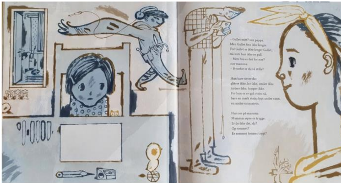
Dahle, 2016, Oppslag 10

Vi får en god oversikt over personene i omgivelsene, og vi kan dermed si at han bruker ultratotal bildeutsnitt. I tillegg kommer vi nærmere på Gullet og mamma. Utsnittene halvtotal og halv nært, brukes for å få frem relasjonen mellom dem, og for å fremheve samtalen de har. Denne bruken av bildeutsnitt er i stor grad med på å gi en følelse av at mammaen retter seg mot, og henvender seg direkte til Gullet. Når det kommer til bruk av perspektiv i oppslagene, bruker Nyhus for det meste normalperspektivet, som er det mest brukte perspektivet i bildebøker. I de oppslagene hvor overgrepet finner sted, bruker han derimot verdiperspektivet. Blekkspruten blir presentert i en urealistisk størrelse i forhold til Gullet, for å understreke og fremheve hans kontroll og makt over Gullet. Ved bruk av dette perspektivet, aktiverer Nyhus en sympati hos leseren. Vi får en sympati for Gullet, som står der, naken, liten og maktløs, ovenfor den store, skumle blekkspruten.