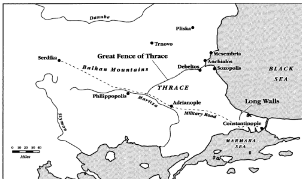
Utbredelsen av Erkesia. 222

Arkeologiske funn gjort fra den tidlige perioden til bulgarerne kan hjelpe oss med å belyse hva bulgarerne hadde gjort fra tiden de bosatt utenfor de litterære kildene. Utbyggingen av forsvarsverket Erkesia (også kalt for the Great Fence of Thrace) i området nært den bysantinske grensen i Trakia utført av bulgarerne framstår som en viktig begivenhet i denne sammenheng. Denne “grøften” blir beskrevet som følger: “It is almost 140 kilometres long: the ditch was about a metre deep, the bank, made of the fill from the ditch, was a metre high, and the whole structure extended across some eighteen metres.” 223 Det finnes også litterære kilder som gjør referanser til dette forsvarsverket. Den bysantinske keiseren Nikeforos Phocas i år 967 beskriver hvordan han marsjerer sin hær til den store grøften i Trakia. 224 Etableringen av Erkesia er gjerne plassert rundt år 816 når den blir nevnt i en fredsavtale mellom Bysants og Bulgaria. Deler av den skal ha blitt startet hundre år før omkring år 716. Dette er basert på at grensene beskrevet i 816 er veldig lik de beskrevet i 716. Den vestlige delen av Erkesia er forstått som å ha blitt startet etter fredsslutningen mellom Bulgaria og Bysants i 716. De to andre delene, Lille Erkesia og østlige Erkesia er antatt å ha blitt startet