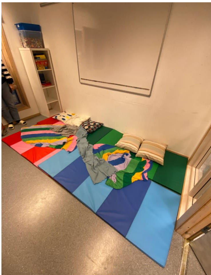
Foto 1. Klart for lesestund

Før vi begynte å lese fortalte vi kort om tittelen på boka, at vi skulle lese hele novellen, stille noen spørsmål underveis og tegne til slutt. Den litterære samtalen var delt inn i to