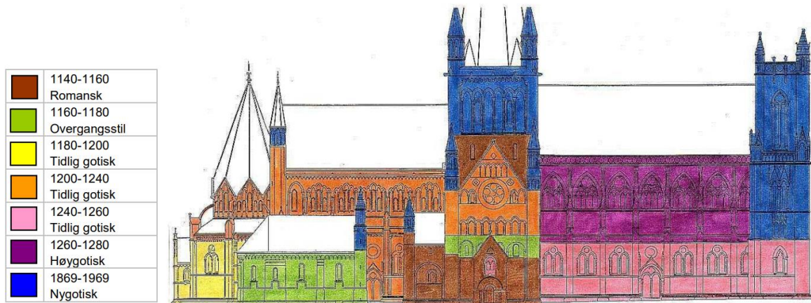
Opprinnelige byggeperioder for Nidarosdomens nordfasade

omorganiseringen skal bedriften besvare sine oppgaver knyttet til restaurering, formidling og kompetansesenter.