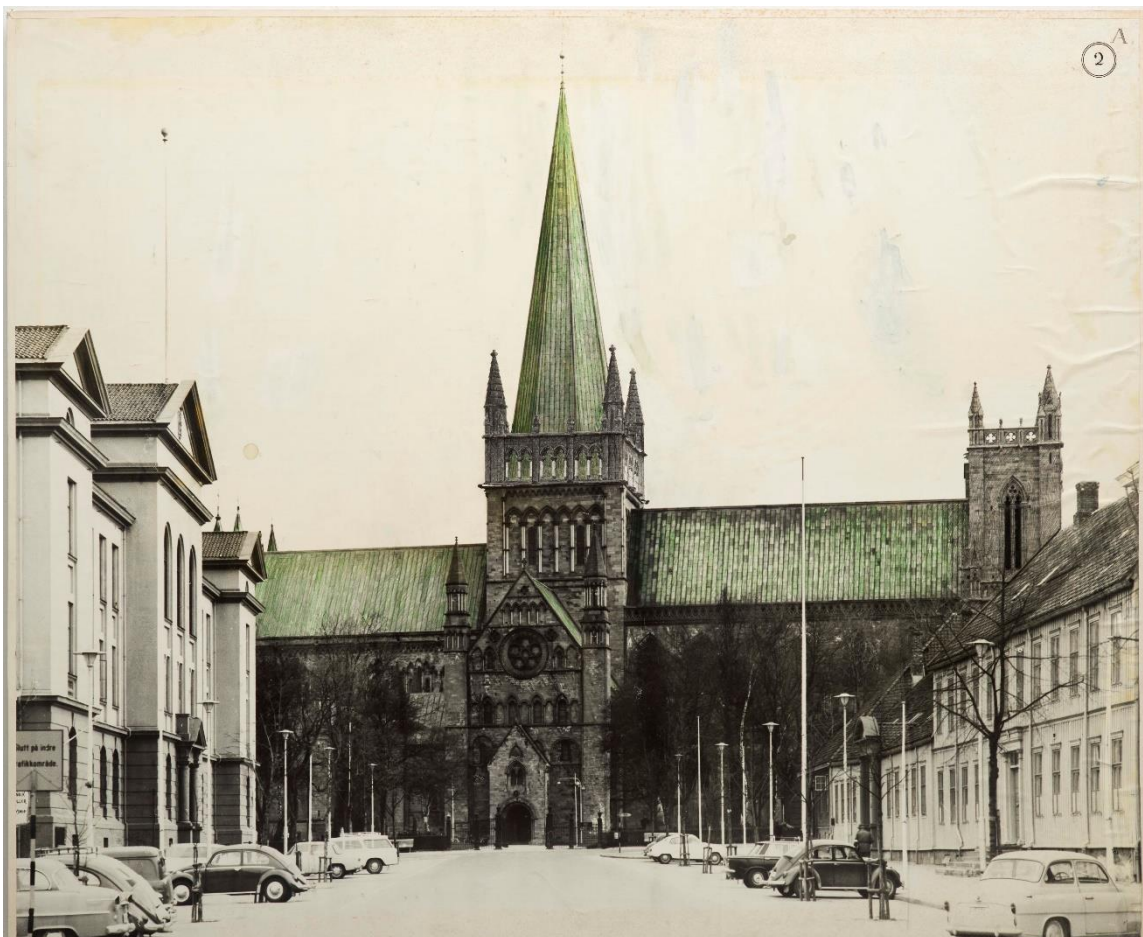
Bilde 1: Thiis' forslag til hovedtårnet der Christies tårn har et ekstra parapet for å gi illusjon av et høyere tårn (lånt fra NDRs tegningsarkiv: 7855)