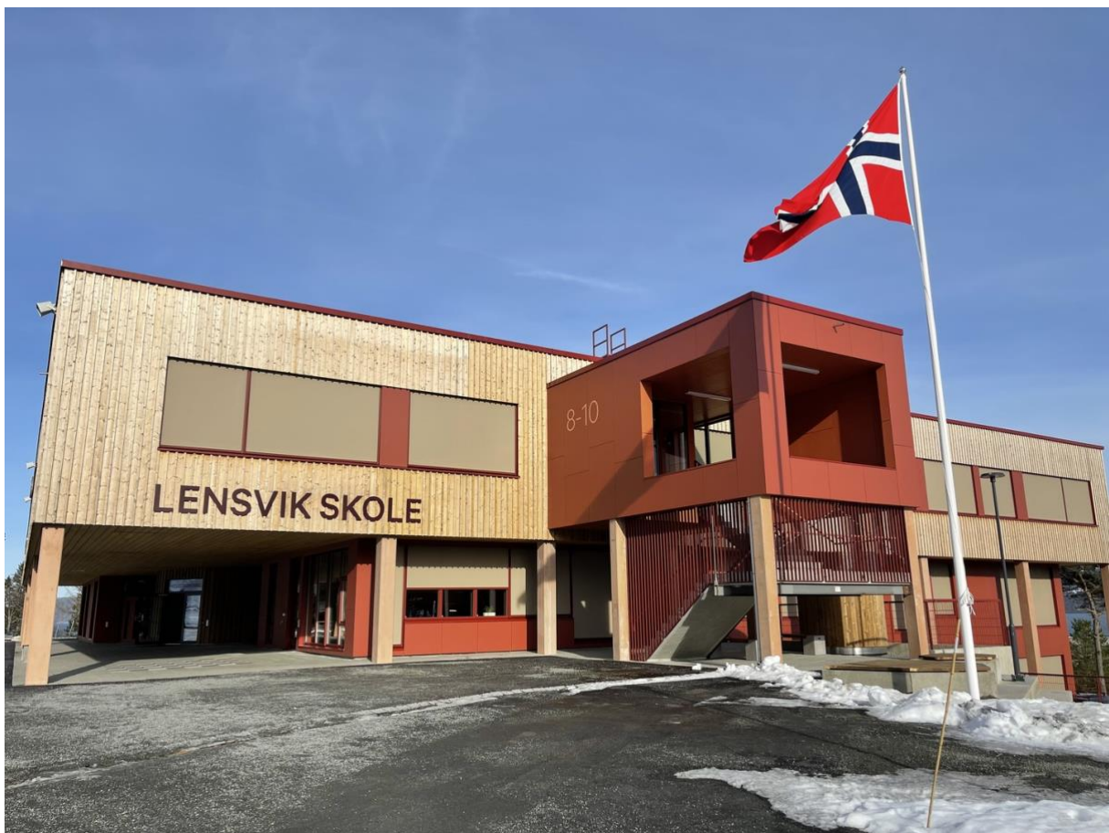
Figur 5. Lensvik skole- Åpnet i februar, 2022. (Hentet 27.04.24. Fra Orkland kommune).