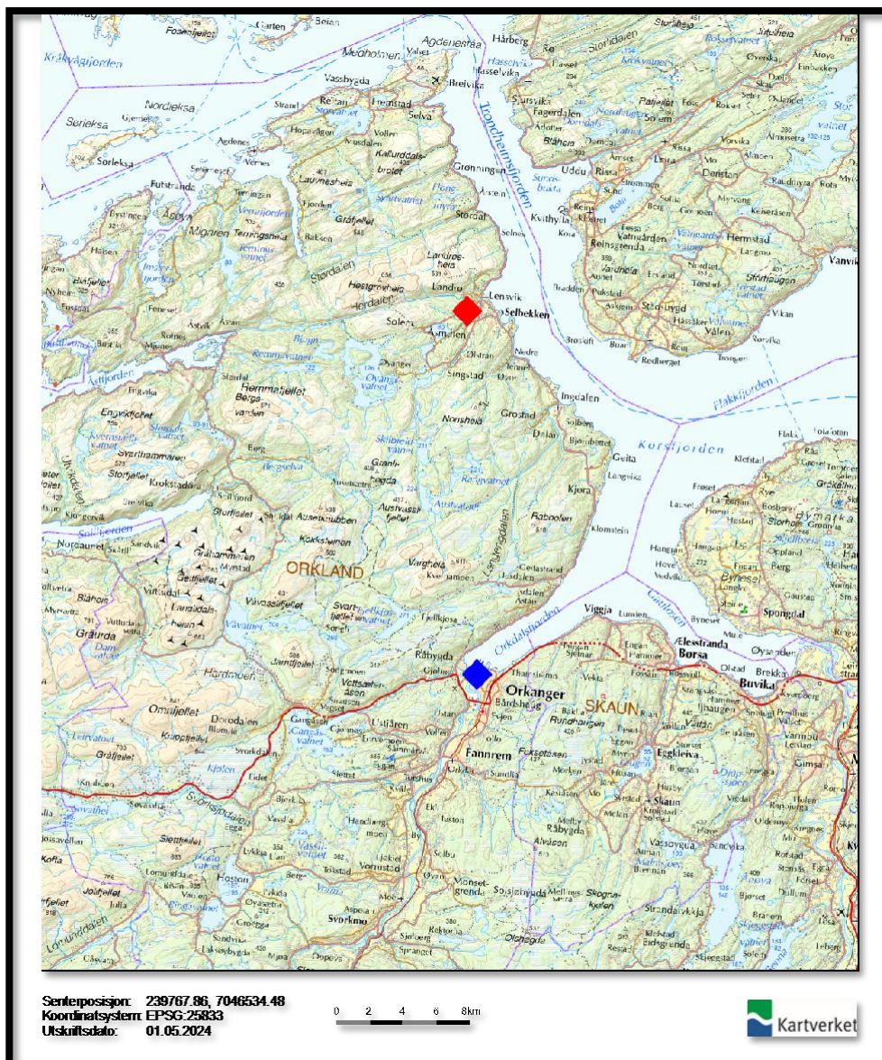
Figur 2. Lensvik markert med rød, Orkanger markert med blå.

som tidligere befant seg i Agdenes kommune i Trøndelag fylke før kommunesammenslåingen, var et nært fellesskap der innbyggerne delte sterke bånd og en følelse av tilhørighet. Lensvik har godt med landbruk og har spesialisert seg på jordbær og pelsdyroppdrett (Haugen, 2024). De lokale ressursene, inkludert skoler, idrettsanlegg, kirker og butikker, har bidratt til samhold og trivsel blant lokalbefolkningen i Lensvik. Lensvik er kjent for jordbær dyrking med sitt gode klima og jordsmonn og bidrar med å gi verdens beste jordbær til folket (Visit Orkland, u.å.). Lensvik var et levende og inkluderende fellesskap der samarbeid, engasjement og støtte fra alle samfunnsmedlemmer bidro til å forme et positivt og bærekraftig miljø å bo og trives i.