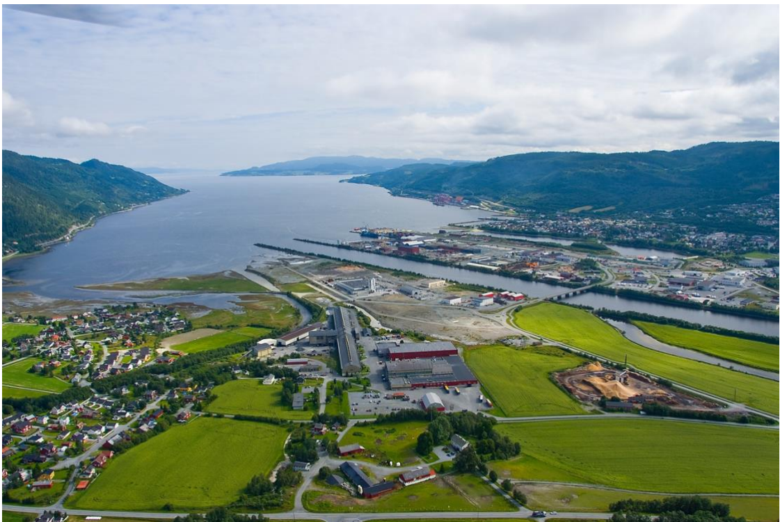
Figur 1. Bilde over Orkanger og ut mot Orkdalsfjorden.