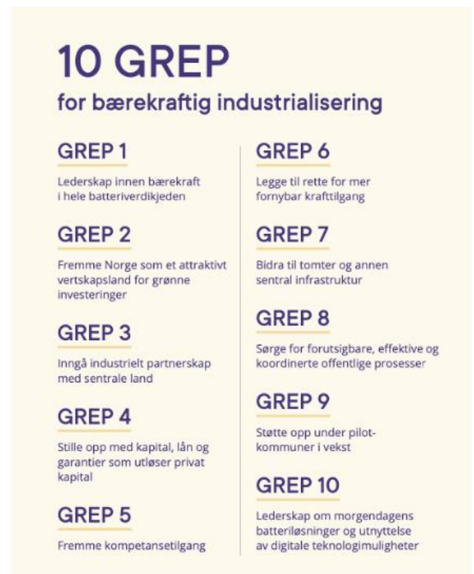
Figur 3 - De ti grepene som blir presentert i Norges batteristrategi (Nærings- og fiskeridepartementet, 2022a)

De ti ulike grepene om hvordan Norge skal engasjere seg i batterimarkedet. Disse ti grepene handler om hvordan nasjonen skal ta lederskap innen bærekraftig teknologi og industri ved å etablere industrielle partnerskap, tiltrekke investeringer og støtte kompetanseutvikling. Samtidig er målet å prioritere fornybar kraft, infrastruktur og effektive offentlige prosesser. Pilotkommuner får støtte, og Norge tar også lederskap i batteriløsninger og digital innovasjon. (Nærings- og fiskeridepartementet, 2022a)