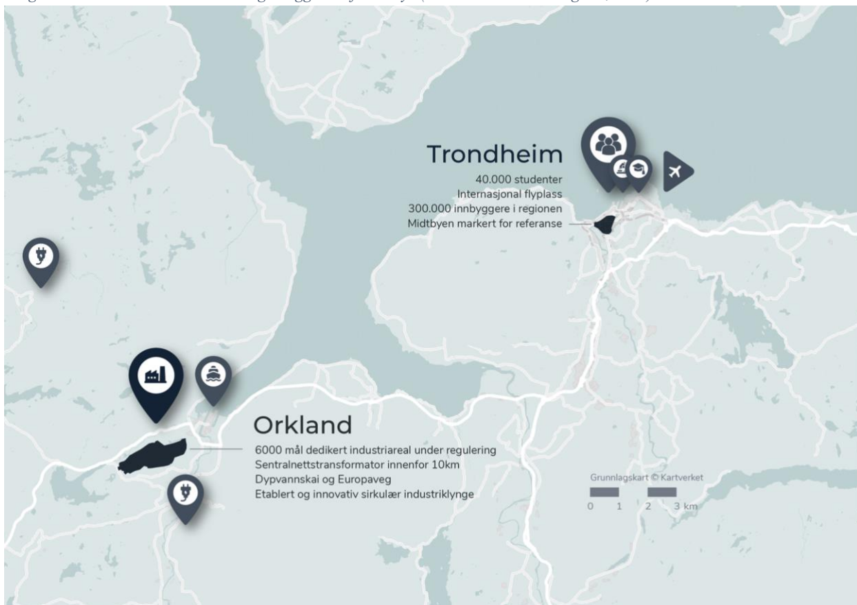
Figur 2 - Kart som viser målestokk og beliggenhet for Eiktyr (Norsk Industriutvikling AS., 2023)

Elinor Batteries skal utgjøre første byggetrinn i Eiktyr industripark som er planlagt å ligge i et stort utmarksområde like sørvest for Orkanger sentrum i Orkland kommune. Selve batterifabrikken skal utgjøre den nord-østligste delen av den totale industriparken som etter planen vil omfatte 6600 mål. For referanse, hadde man lagt plankartet over trondheimskartet, ville planområdet strukket seg fra Munkholmen til Sluppen (Figur 1) (Morken, 2024) Lokasjonen til fabrikken er ikke tilfeldig. Allerede i 2017 jobbet Norsk Industriutvikling med å etablere en batterifabrikk i Trøndelag. En av hovedgrunnene er krafttilgangen gjennom vannkraftverkene som fins i området, da en slik fabrikk vil komme til å kreve store mengder energi (Bævre, 2022). I tillegg trekkes nærhet til Trondheim, som vist i figur 1, frem som en fordel da Elinor Batteries har tette bånd med Sintef og NTNU-miljøet i byen (Børstad, 2023).