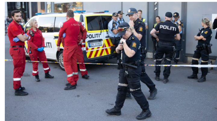
FURUSET SENTER: Politiet sperret av et større område mandag etter at to unge menn knivstakk hverandre på Furuset i Oslo.

Av ANNE SOFIE MENGAEN ÅSGARD, MORTEN S. HOPPERSTAD og GABRIEL AAS SKÅLEVIK (FOTO) 5. desember 2022