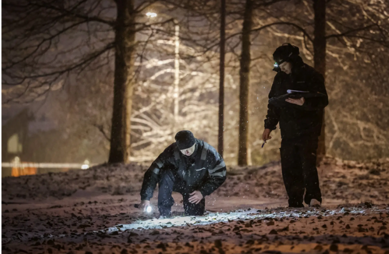
SKYTING FURUSET: Politiet i gang med etterforskningen etter at en mann ble skutt på Furuset i november.