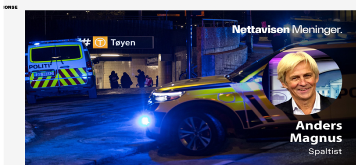
NÅR EN TILFELDIG ungdom blir stukket ned på T-banen og forsøkt drept en lørdag kveld, er det grunn til å spørre seg om Oslo er en trygg by.