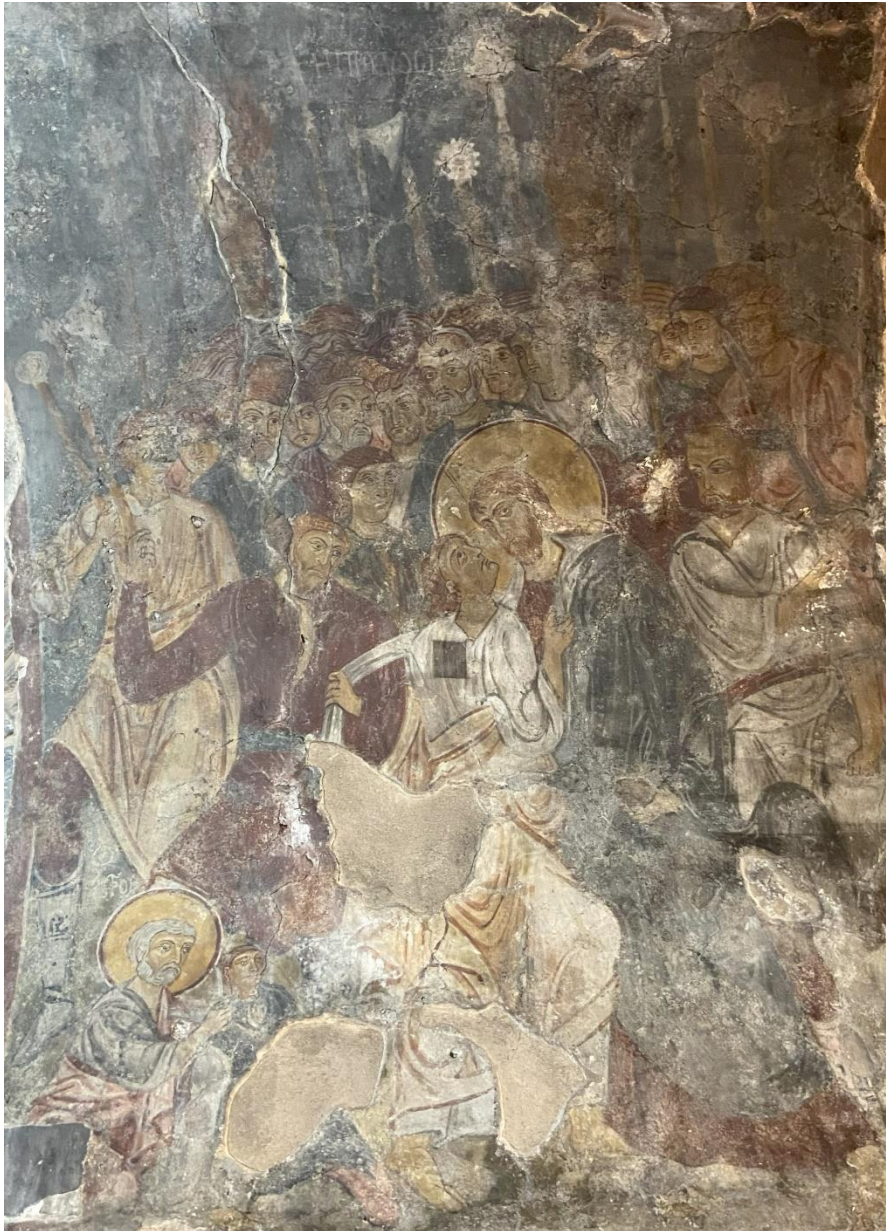
Figur 8. Arrestasjonen av Kristus. Fresko, Panagia Antiophonitria, Myriokephala, Kreta.