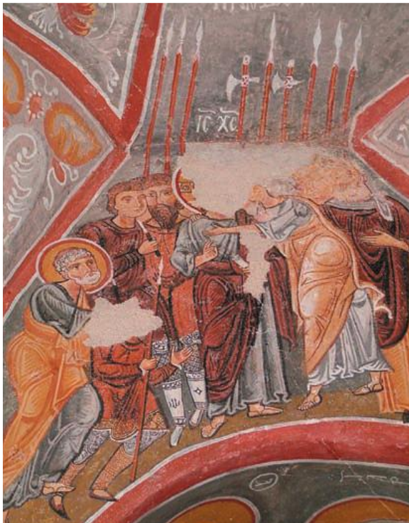
Figur 6. Arrestasjonen av Kristus. Fresko, Elmalı Kilise, Kappadokia. Foto hentet fra D'Amato, «military iconography», 76.

Øksene i øvrige fremstillinger av arrestasjonsscenen ligger nærmere den skandinaviske stridsøksen, som de som kan observeres i fresker fra kirkene Elmalı Kilise og Çarıklı Kilise i Göreme i Kappadokia. (fig. 6-7). 180 På samme måte som Balıklı Kilise er disse blitt datert til siste halvdel av det 11. århundre. De må dermed ha blitt produsert i perioden rett før regionen ble invadert av Seldsjukkene og falt ut av bysantinsk kontroll etter nederlaget ved Manzikert i 1071. 181 Det tydeligste fremstillingen av skandinaviske stridsøkser finnes imidlertid i kirken Panagia Antiophonitria fra Myriokephala på Kreta. (fig. 8). 182 Øksehodene her har en avsats fra midten hvor de smalner kraftig inn, samtidig som den øverste kanten av eggen svinger oppover. Ser man nærmere på øksen til venstre i scenen, kan man også identifisere vertikale skaftfliker der øksehodet omslutter skaftet. Generelt er denne utformingen typisk for skandinaviske stridsøkser fra perioden fra midten av det 10. til midten av det 11. århundre, og tilsvarer type L i Jan Petersens typologisering av våpen fra vikingtiden (fig. 9). 183 Dateringen av fresken er ikke ubestridt. De stammer trolig ikke fra klosterets grunnleggelse rundt 1020, men kan være produsert senere på århundret eller så sent som i det 12. århundre. 184 Det avgjørende her er at skandinaviske våpen må ha blitt brukt som modell.