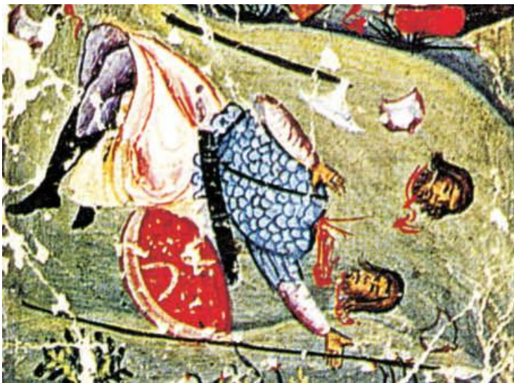
Figur 13. Andre dag av slaget mellom de elleve stammene av Israel og stammen av Benjamin ved Gibeon. Illustrasjon, Cod. Ath. Esphigmenou, folio 417v, detalj. Faks. fra Pelekanidis, m.fl., The Treasures of Mount Athos, vol. 2.