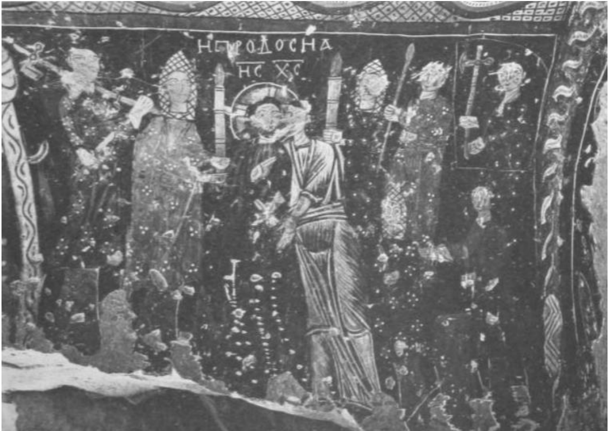
Figur 4. Arrestasjonen av Kristus. Fresko, Balıklı Kilise, Kappadokia.