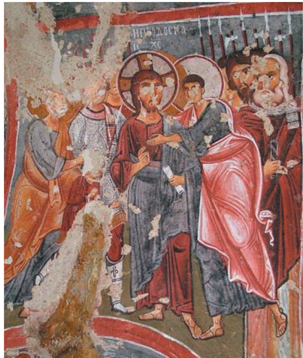
Figur 7. Arrestasjonen av Kristus. Fresko, Çarıklı Kilise, Kappadokia.