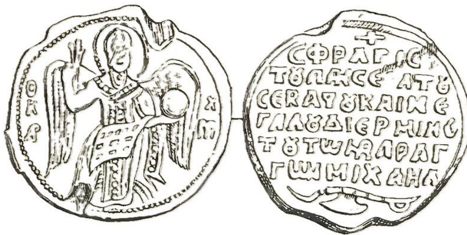
Figur 3. Blyseglet til sebastos Mikael, øverste tolk for væringene. Illustrasjon hentet fra Schlumberger, G. L. Sigillographie de l'Empire byzantin , 350.