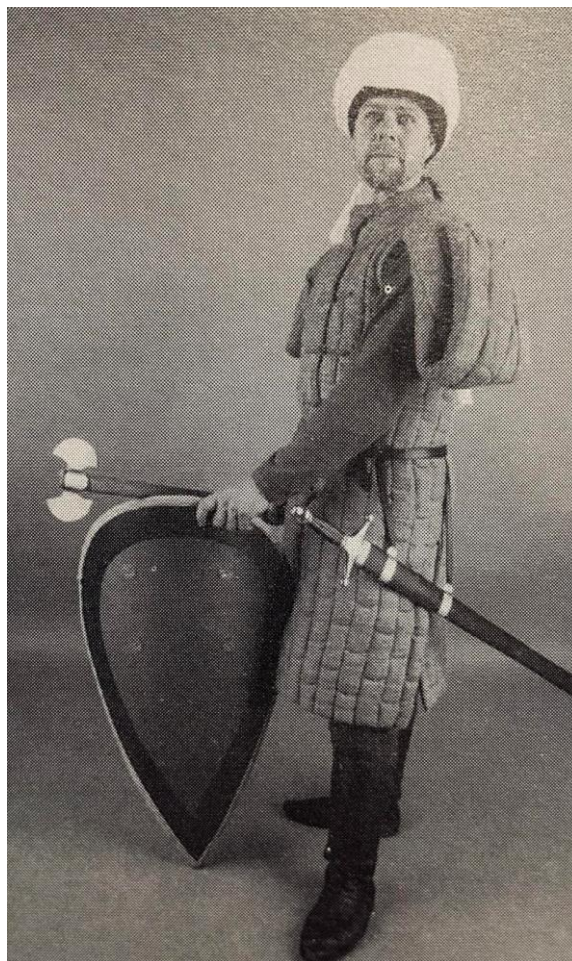
Figur 3 (h). Rekonstruksjon av kriger med tveegget tzikouri. Våpenet er av en kortere type sammenlignet med fremstillingene i mosaikken.

I en undersøkelse av kunstneriske fremstillinger av økser i bysantinsk kunst, har Taxiarchis Koliass påpekt de mange motivene som viser lange eneggede stridsøkser, hvor skaftet ikke slutter umiddelbart ved øksehodet, men forlenget med noen centimeter, ofte i form av en spydspiss. Slike langskaftede våpen er blitt postulert av Koliass å representere en mulig utvikling av den lange stridsøkser som ble introdusert med krigere fra Skandinavia, der enden på skaftet har blitt forlenget, samtidig som formen på selve øksehodet er blitt modifisert etter orientalske forbilder. 174 I hvilken grad utviklingen var et reelt faktum eller resultatet av sammenblanding av ulike våpen i kunstnerens fantasi er uvisst, men en slik modifikasjon, som ville gjort øksene effektive som støtvåpen, er ikke utenkelig tatt i betraktning det økte møtet med kavaleri som skandinaviske krigere møtte i bysantinsk tjeneste. 175