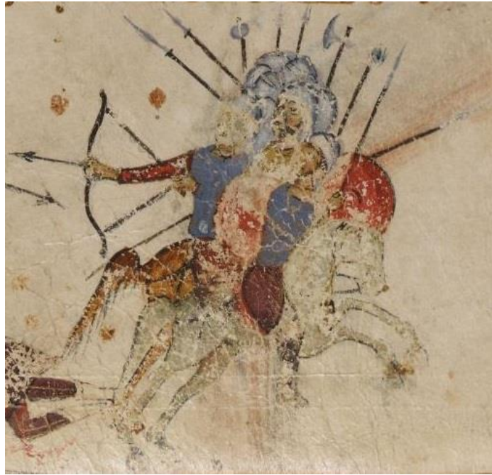
Figur 12. Beleiringen hvor Uria blir drept. Illustrasjon, Psalter of Theodore of Caesarea, BL Add MS 19352, folio 63v, detalj. Faks. fra Theodore Psalter. Electronic facsimile.