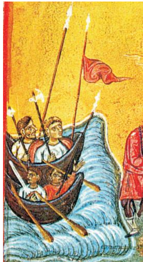
Figur 14. Scene fra livet til martyren Arethas. Illustrasjon, Cod. Ath. Esphigmenou, folio 136v, detalj. Faks. fra Pelekanidis, m.fl., The Treasures of Mount Athos, vol. 2.