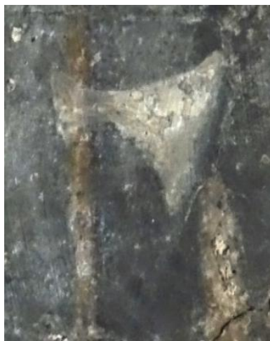
Figur 8.2. Detalj øksehode h.