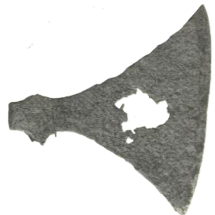
Figur 9. Øksehode type L.