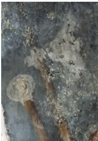
Figur 8.1. Detalj øksehode v.