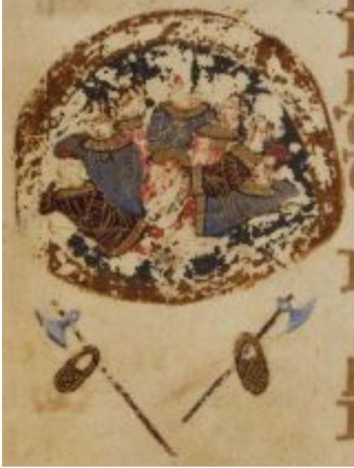
Figur 11. Sovende vakter utenfor graven. Illustrasjon, Psalter of Theodore of Caesarea, BL Add MS 19352, folio 36v. Faks. fra Theodore Psalter. Electronic facsimile.