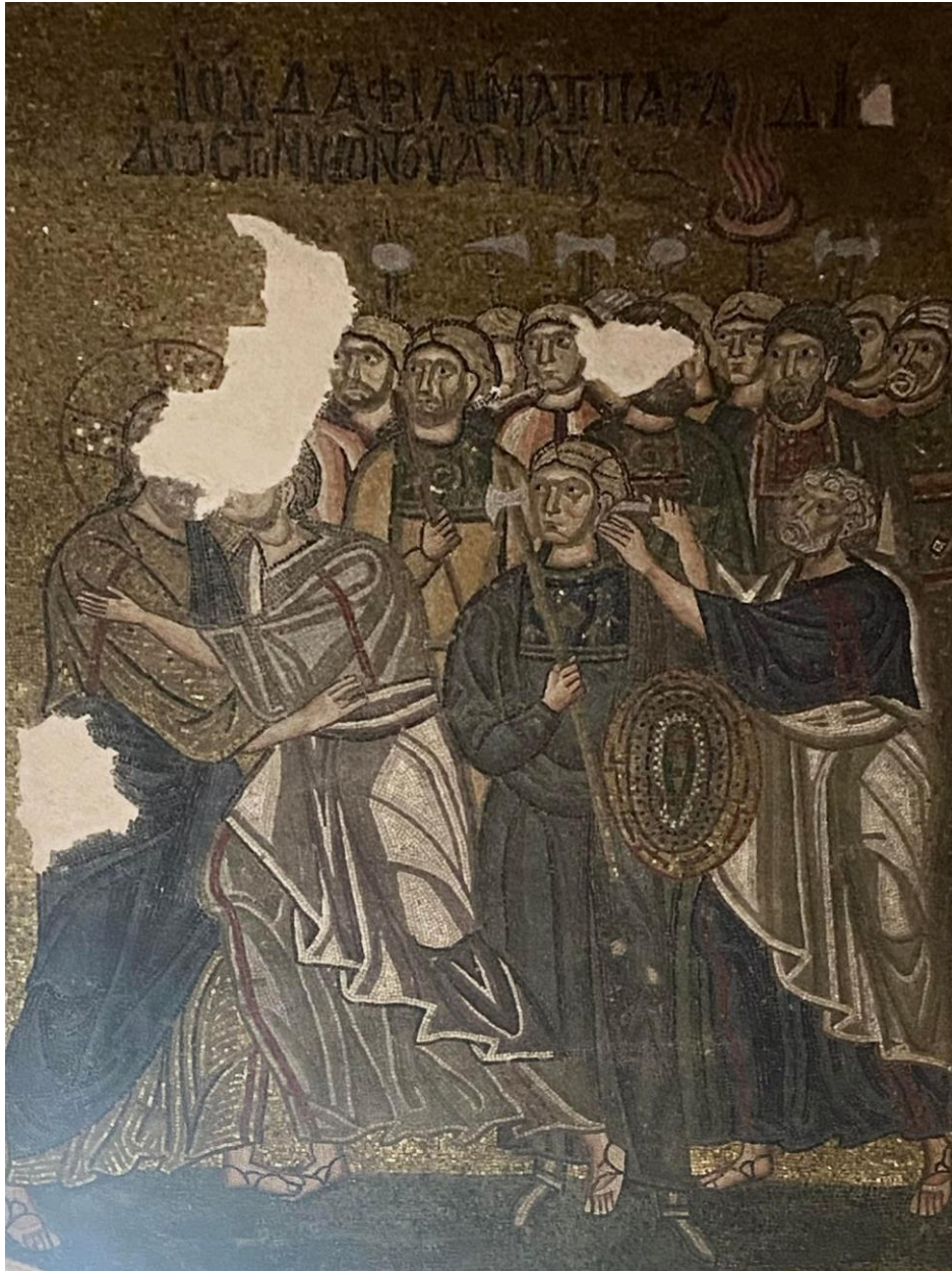
Figur 1. Arrestasjonen av Kristus. Mosaikk, Nea Moni, indre narthex, Khios.

Øksenes utforming gjør dem ikke automatisk identifiserbare som stridsøkser av skandinavisk type, men er enten tohodede eller strekker seg over begge sider av skaftet og forlenget i en spiss. Denne type økser er forenelige med beskrivelsene av de bysantinske tzikouri eller distrali (fig. 2-3). 173 Disse betegnet imidlertid kortere våpen, mens øksene i mosaikken har lange skaft, sammenlignbare med lengden på skandinaviske stridsøkser fra samme periode. Dette kan indikere at den ansvarlige kunstneren kan ha kombinert inntrykkene fra ulike våpen i samme fremstilling.