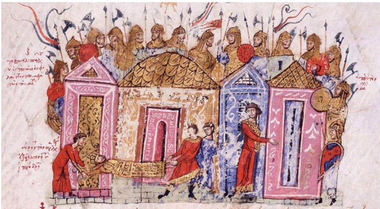
Figur 5. Liket til den myrdede Keiseren Leo V. blir båret ut av palasset. Illustrasjon, Madrid, Cod. Vitr. 26–2 , fol. 26v, detalj. Faks. hentet fra Tsamakda, Illustrated Chronicle .