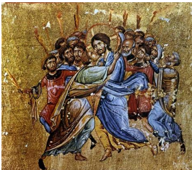
Figur. 10. Arrestasjonen av Kristus. Dionysiou Cod. 587m. fol. 104v. Faks. fra Pelekanidis, m.fl., The Treasures of Mount Athos, vol. 1, s. 188.

Samtidig er øksebærere synlige i tre illustrerte manuskript fra samme periode. I en av de overleverte evangeliske leksjonsbøkene som i dag er oppbevart på klosteret Dionysiou på Athos ( Dionysiou Cod. 587 ), og som ble nedtegnet i 1059, er arrestasjonsscenen fremstilt på tilsvarende måte som i kirkekunsten fra samme periode. Her kan fire øksebærere observeres blant mennene i bakgrunnen (fig.10). 185 Tydelige fremstillinger finnes også i det såkalte Theodorpsalteret ( London, B.L. Add. 19.352 ), oppkalt etter sin forfatter, presten Theodoros fra Caesarea i Kappadokia, som ferdigstilte manuskriptet i Konstantinopel i 1066. 186 Her påtreffes lange eneggede stridsøkser i to illustrasjoner; i den ene liggende i kryss ved siden av de sovende vaktene utenfor Jesus' grav (fig.11); 187 og den andre i fremstillingen av gammeltestamentlige begivenheter med fortellingen om Uria (fig.12). 188 Videre kan økser med samme type utforming observeres blant soldatene fremstilt i et rikt illustrert menologium fra klosteret Esphigmenou på Athos ( Esphigmenou Cod. 14 ), datert til mellom 1070 og 1100. 189 To av de totalt åtti miniatyrene tilhørende de hagiografiske tekstene inneholder fremstillinger av stridsøkser. Den ene ligger ved siden av det mutilerte liket til en fallen soldat i en fremstilling av slaget ved Gibeah mellom de elleve stammene av Israel og Benjamin (fig.13). 190 Den andre viser to øksebærere i en båt, og er hentet fra en scene fra livet til martyren Arethas (fig.14). 191