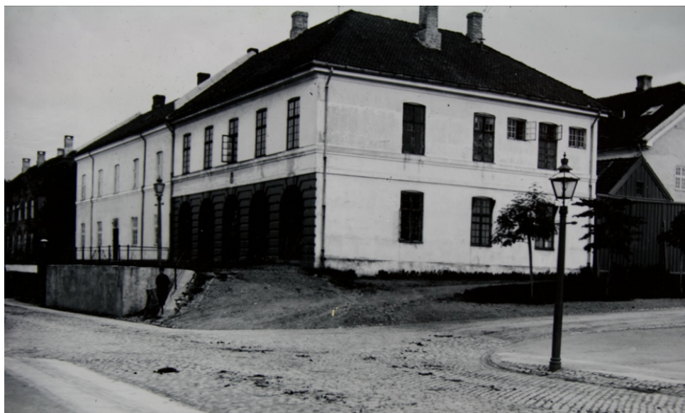
Bilde 1: Skansevaktens før endringene i terrenget og etablering av den dobbeltløpende trappen i front. Ukjent dato, men før da terrenget ble senket i 1901.

blitt omgjort til bruk som kontorlokaler. Rundt 2016 ble bygningen solgt av NTNU og er i dag eid av selskapet NorInvest. Bygget er fortsatt i bruk, hvor deler av bygningen leies ut til et kunstnerpar som bruker lokalene som atelier. 24 Skansevaktens bakgrunn viser de skiftende behovene og prioriteringene i Trondheims samfunn og kulturliv, samtidig som de har bidratt til å bevare og revitalisere bygningens historiske betydning.