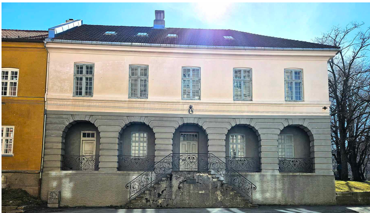
Bilde 3: Skansevakten sett fra Kongens gate, som viser fronten med smijersrekkverket.

Bilde 3 viser bygningens flotte fasade, og det som tidligere tjente som inngang. 32 Loggiaen er under en arkade av fem buer, laget av en imitert kvadermur som er inndelt. Dette står i kontrast til de ellers slette veggene på bygningen. Skansevakten er i dag malt i en rosa nyanse, med grå mur og imitert kvadermur på husets front. Mørtelen bygningen er murt opp med har blitt rehabilitert opp til flere ganger i bygningens levetid, men totalt sett er mørtelen i god stand. 33 Det er noen avskallinger på mørtelen, men tidligere bilder og beskrivelser av Skansevakten viser at dette er noe som har blitt fulgt nøye med på og utbedret jevnt over.