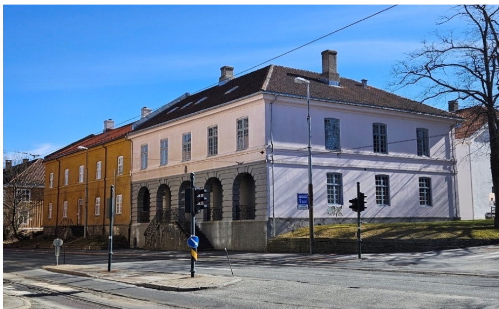
Bilde 2: Skansevaktens nåtid, i samme vinkel som foto fra Justismuseet. Foto: Rebecca Dillner, 16. april 2024.