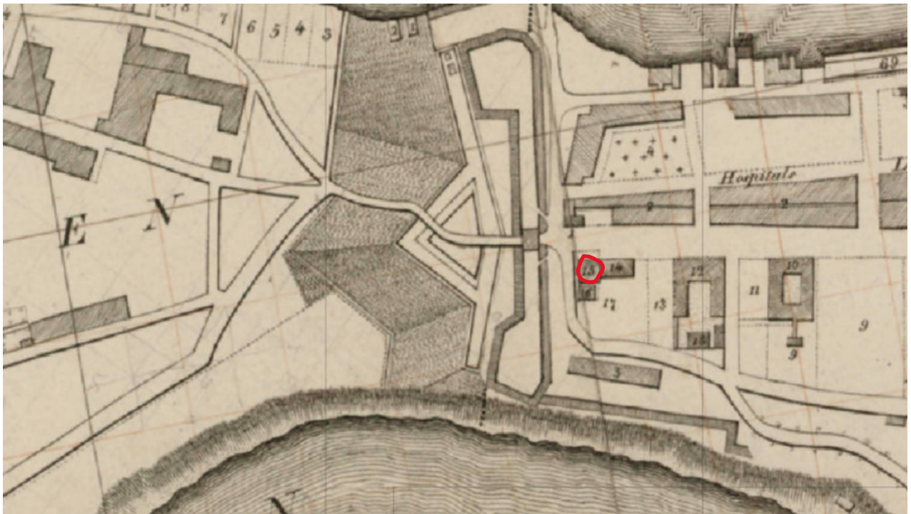
Figur 1: Kartverket, Kobberstikk av Sør-Trøndelag, som viser Ilevollen/Kalvskinnet bebyggelse i 1830. Skansevakt er uthevet med rød ring. 17

Kongens gate er en historisk viktig gate – og område i Trondheim. Gaten som går fra Kjøpmannsgata til Ilevollen, fikk sitt nåværende navn den 10. september 1681, av byplanleggeren Cicignon. 16 Denne veien har vært hovedinnfartsåren på fastlandet i Trondheim by i over 1000 år. Den eneste muligheten for de som kom gående eller ridende inn i Trondheim by var å bruke denne veien, som er også begrunnelsen på hvorfor byporten og tilhørende vaktus senere ble plassert her.