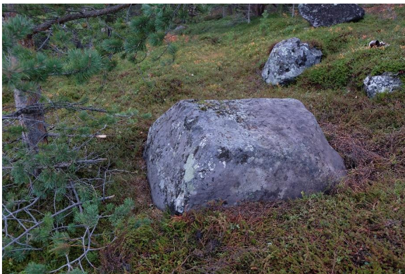
Figur 4: Flyttblokka, Kongsvika/Doarrás 2

Hjemmeluft og Kongsvikfjæra er svært ulike områder, både når det gjelder størrelse og spredning av bergkunsthelt, og når det gjelder omfanget av figurer. Hjemmeluft består av mange felt med store mengder figurer, som er spredt utover et stort geografisk område. Derimot består Kongsvikfjæra kun av to felt og en flyttblokk, og har et fåtall kjente figurer. Hjemmeluft inngår i verdensarvområdene for bergkunsten i Alta, mens Kongsvikfjæra ikke gjør det. Likevel skal bergkunstlokalitetene i Kongsvikfjæra behandles på samme måte som de i Hjemmeluft. Helleristningene i Alta har vært kjent for kulturminneforvaltningen siden 1973, og bergkunsten i Alta har hatt verdensarvstatus siden 1985. Etter innskrivningen på UNESCOs verdensarvliste har det blitt oppdaget flere lokaliteter, dette betyr at det finnes bergkunst i Alta som ikke offisielt har verdensarvstatus. En måte kulturminneforvaltningen har løst dette «problemet» på, er ved å vedta at all bergkunst i Alta skal forstås som støttende verdier til verdensarven. 64 Dette tydeliggjør at forvaltningen er klar over at det finnes uoppdagede lokaliteter, og at disse også er viktige for verdensarven.