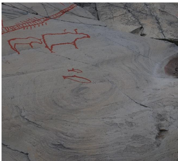
Figur 1: Bergbukten 1

og 26,5 meter over dagens havnivå. 42 De vanligste figurene er reinsdyr og elg, men det er også funnet mange bjørner og bjørnespor. En mer sjelden figur er haren. Selv om hare sannsynligvis var et vanlig dyr i steinalderen, kjenner man kun til to avbildninger av den fra bergkunsten. Et aspekt som er interessant med helleristningene er hvordan figurene er plassert på berget. Det kan virke som bergflaten har blitt brukt som et eget «landskap», og at figurene har blitt hogget inn på en måte som fungerer med bergflaten. 43 Eksempler på dette er figurer som viser hvaler/fisker som ser til å hoppe opp fra en naturlig forekommende spiral i berget, 44 og en elg/rein som ser ut til å bøye hodet ned for å drikke av en grop i bergflaten som naturligvis vil fylles med vann ved regnvær. 45