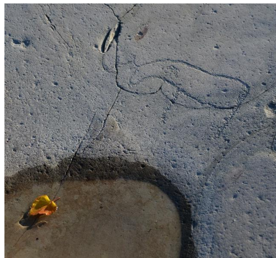
Figur 2: Bergbukten 4A

I Alta ble bergkunsten oppdaget relativt sent, og det blir fortsatt oppdaget nye felt den dag i dag. Bergkunsten i Alta er lite synlig i landskapet, og den har lenge vært dekket av tykke lag med torv. Der bergflaten har vært eksponert, kan ugunstige lysforhold ha bidratt til at den ikke har blitt oppdaget tidligere. 46 Alta ligger langt nord, i midnattsolens land, så ved sommertid går ikke solen ned, og om vinteren går den ikke over horisonten. Helleristninger er som nevnt figurer hogget, risset eller slipt inn i bergflaten, og vil være mer synlig med lys fra en skrå vinkel, for eksempel ved solnedgang.