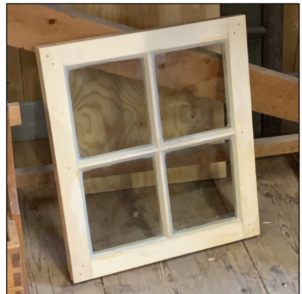
Figur: Slik ble resultatet, et helt ekte vindu, uten skruer!

Dette prosjektet var noe jeg kun holdt på med da jeg hadde tid. Jeg var med på møter, med håndverkere da de laget taubanebukk 1 og jeg fikk delta på vindusrestaureringskurs. På kurset var det meg og to snekkere, samt kurslærer Olaf Piekarski. Det å forstå arbeidet som ligger bak et vindu var svært lærerikt. I de første kursdagene lærte både jeg og