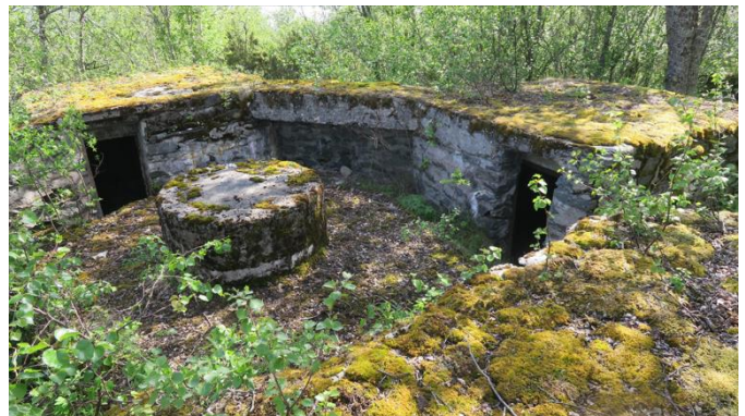
Figur 13: Kanonstilling på Trondenes Fort med fire dekningsrom delvis utført i betong og stein, antatt luftvern, (u.å), av Øystein Hagland, hentet fra Riksantikvaren. https://riksantikvaren.no/fredninger/trondenes-fort/