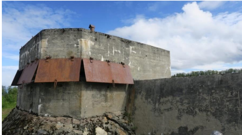
Figur 6: Trondenes Fort kommandoplass for 88 mm luftvernsbatteri, (u.å), av Øystein Hagland, hentet fra Riksantikvaren. https://riksantikvaren.no/fredninger/trondenes-fort/

Alle de fire kanonene bygd til Atlanterhavsvollen på Trondenes, eksisterer enda, og en av de blir jevnlig brukt til omvisning. Kanonene er ikke endret utseendemessig siden andre verdenskrig, dog de ikke er i bruk. Alle kanonene stod ferdig i 1943.