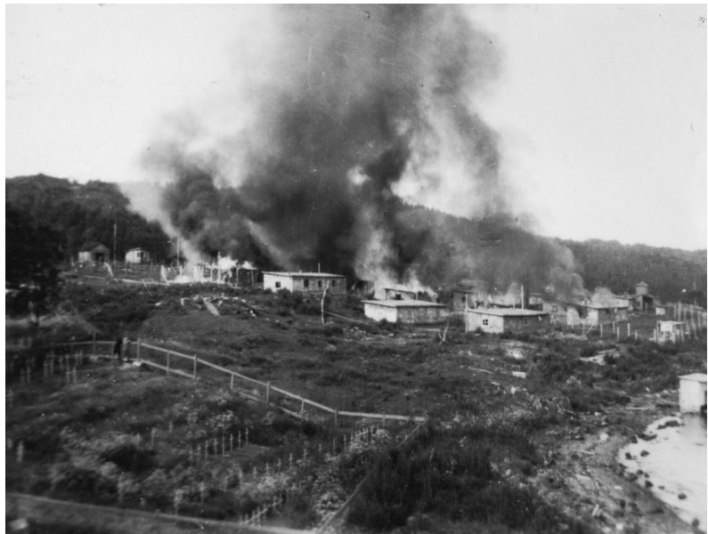
Figur 4: Russefangeleiren på Trondenes brennes ned, 1946, av ukjent fotograf. ( https://digitaltmuseum.no/021015445381/russefangeleiren-pa-trondenes-brennes-ned ). TD.F-12675

Figur 4 viser fangeleiren i full brann 4. juli 1946. Den overveiende grunnen til påtenningen, var smittefaren og at det var uforsvarlig å fortsatt ha fangeleiren i landskapet. (Harstad Tidene, 1946). Man ser også at den sovjetiske kirkegården, har blitt overgrodd av vegetasjon. Man ser noen bygninger i bakgrunnen som ikke er satt fyr på, og da trolig ikke var en del av fangebrakkene.