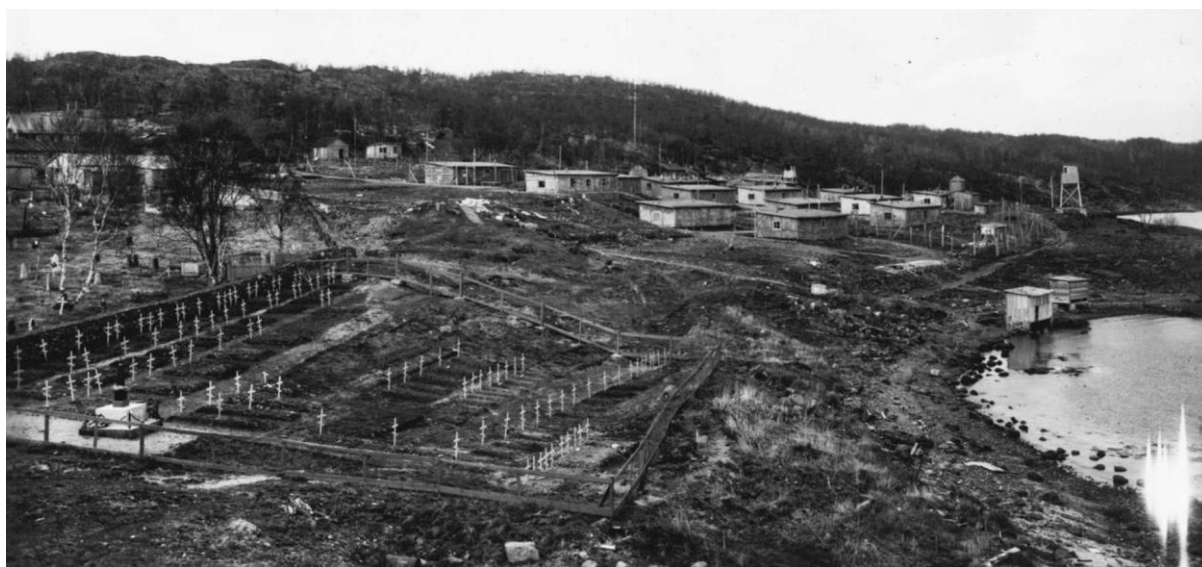
Figur 2: Krigsfangekirkegården og fangeleiren på Trondenes, 1945, ukjent fotograf. ( https://digitaltmuseum.no/011015087360/krigsfangekirkegarden-og-fangeleiren-pa-trondenes ). TD.F-12354.