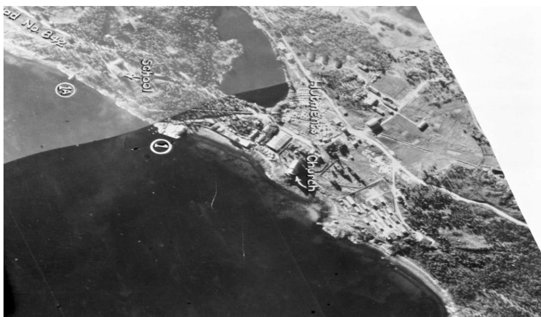
Figur 1: Flyfoto av området rundt Trondeneskirken og Folkehøgskolen, 1943, av Wehrmacht.

Flyfoto og fotografier er en verdifull kilde til historien under andre verdenskrig. Det viser landskapet som var og som nå er borte. De fungerer som tidskapsler som dokumenterer militære installasjoner, strategiske posisjoner og også ødeleggelser. Denne kilden gir arkeologer en god mulighet til å analysere endringene i infrastrukturen og terrenget. De er også avgjørende for å forstå hvordan konsekvensene har utspilt seg i landskapet. Fotoene tjener som en visuell ressurs for formidlingen av historien som har vært og trekker fram minnene assosiert med tiden da fotografiene ble tatt.