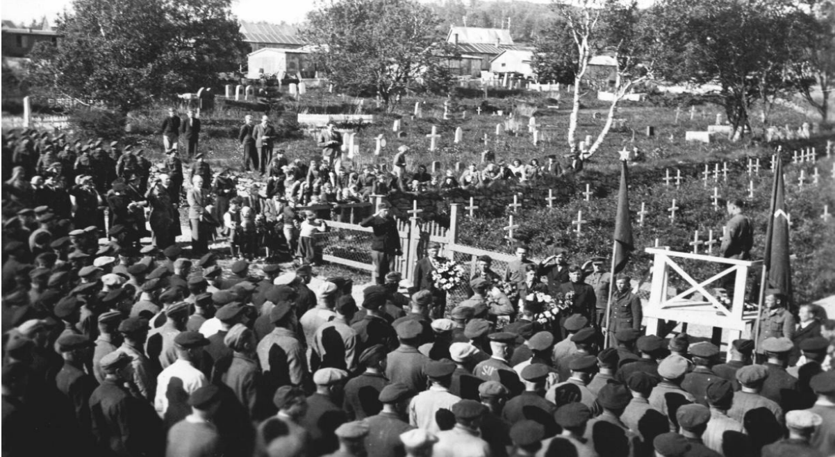
Figur 3: Fra avdukingen av minnesmerket over russefangene som døde på Trondenes. Vi ser noe av leiren i bakgrunnen, 1945