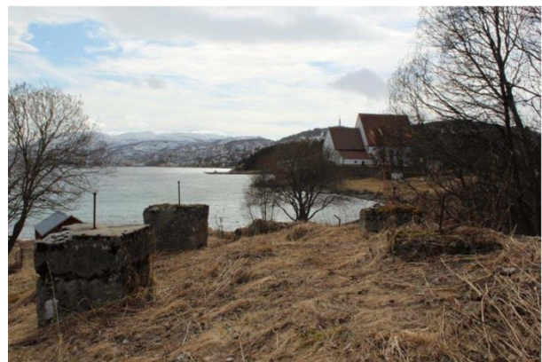
Figur 9: Rester av fundamenter til vakttårn id 21, med Trondeneskirken i bakgrunnen, (u.å).

Figur 10 viser godt synlige fundamenter etter bygningsmasse hvor brakke Id 12 fra figur 8, har vært oppmålt i marka. Fangebrakkene er preget av naturens overtakelse og man ser kun strukturenes omriss av brakkene, for de som er synlig i terrenget. (Narmo 2013, s. 43-44)