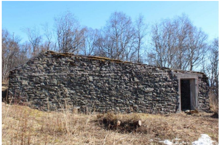
Figur 11: 'Russekirka' med id 49 i figur 7, (u.å).

Id 49 på figur 8, viser det som blir kalt for 'Russekirka'. Denne strukturen er veldig synlig i terrenget 8 og har vært mye omtalt i folkelige vitnesbyrd. Bygningen er laget av stein fuget med betong, og som visstnok er en nyere byggeskikk enn strukturene laget av betong. Beliggenheten og det flate skråtaket antyder at bygningen er en inkorporert del av fangeleiren. (Narmo, 2013, s. 72-74)