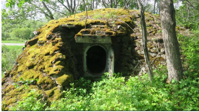
Figur 14: KUSY: Skytestilling, norskutviklet etter andre verdenskrig, (u.å)