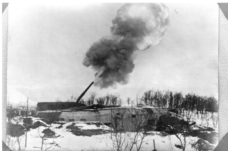
Figur 5: En av Adolf-kanonene på Trondenes Fort avfyres, (1944), av en ukjent tysk soldat. ( https://digitaltmuseum.no/021017308434/en-av-adolfkanonene-avfyres ). TD.F-33815