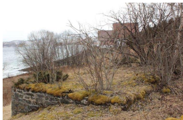
Figur 10: Bygningsfundament etter fangebrakke id 12, (u.å).