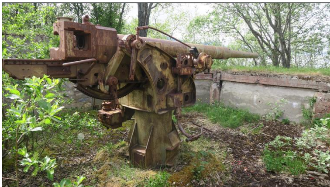
Figur 12: En av tre luftvernstillinger for kommandoplass for 88 millimeter luftvernsbatteri, (u.å)

Figur 12, 13 og 14 viser deler av fortet som er forlatt. Disse illustrasjonene viser de uhåndterte og forlatte stedene ved Trondenes fort som er overgrodd av vegetasjon, men likevel har historie som trenger fram. Tilstanden av fortet som består av betong og stålkonstruksjoner, gjør det vanskelig for naturlig nedbrytning. Grunnet historien den bærer på har det heller ikke vært noen menneskelig påvirkning i dette området på flere tiår, noe man kan se ved at naturen sakte men sikkert prøver å ta tilbake området. (Jasinski, 2012, s. 151-152)