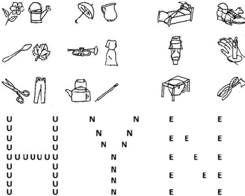
Figur 1 Øverst: Eksempel fra Birmingham Object Recognition Battery, del 6 (overlappende figurer), en målrettet test for objektagnosi. For dette eksempelet vurderes tiden det tar å navngi først de ikke-overlappende figurene til venstre og deretter de overlappende figurene til høyre. Reprodusert med tillatelse fra rettighetshaver Jane Riddoch. Nederst: Navon-bokstaver. En Navon-figur er et større element dannet av flere mindre elementer. På denne figuren danner mange små bokstaver andre større bokstaver. En person med simultanagnosi vil ha problemer med å gjenkjenne denne sammenhengen. Produsert av artikkelforfatterne.