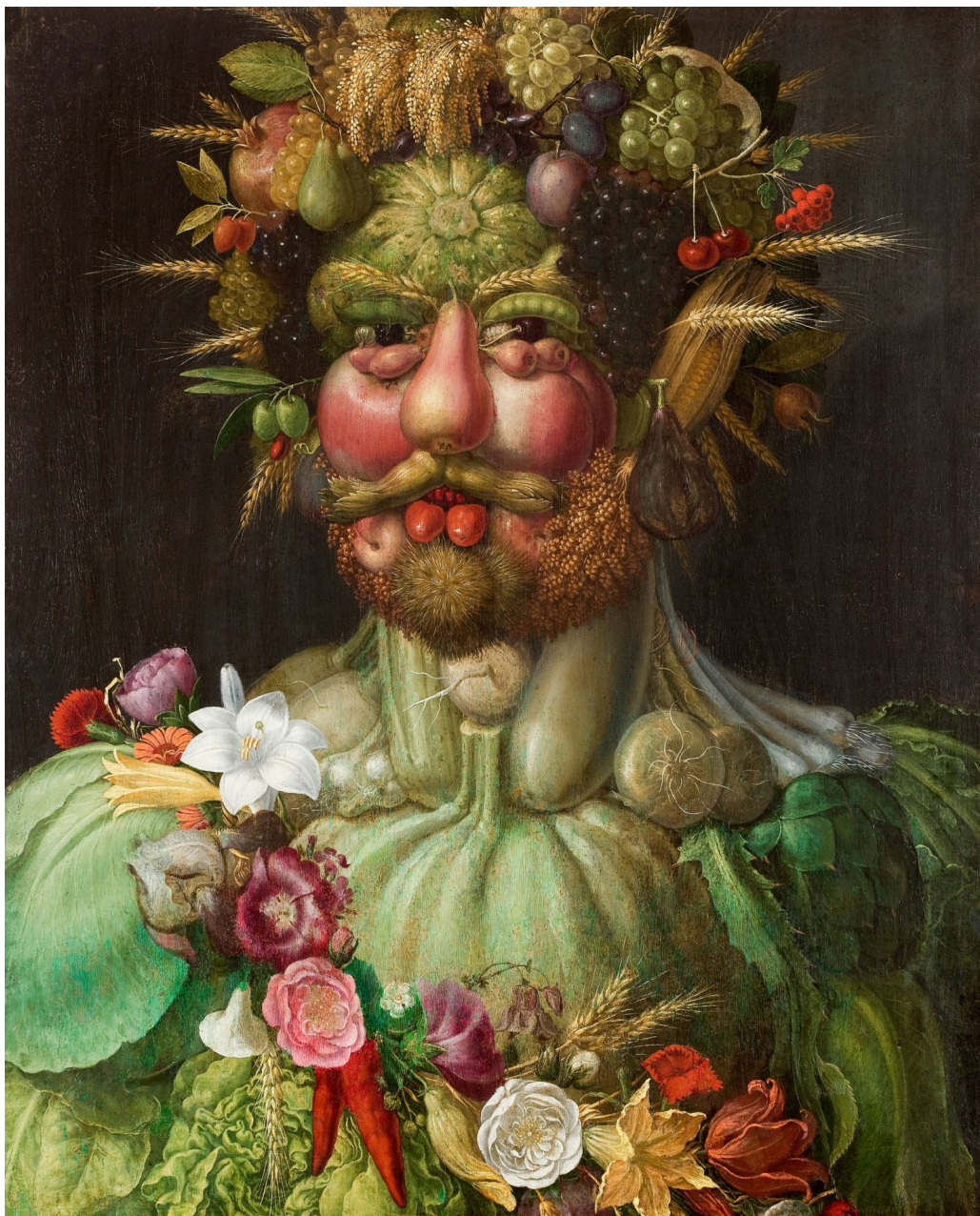
Figur 2 Maleriet Vertumnus av Giuseppe Arcimboldo fra 1591. En person med simultanagnosi vil ha vansker med å se at grønnsakene, fruktene og blomstene til sammen danner et portrett (av keiser Rudolf II).

Vår pasient hadde altså en kombinasjon av homonym hemianopsi og objektagnosi.