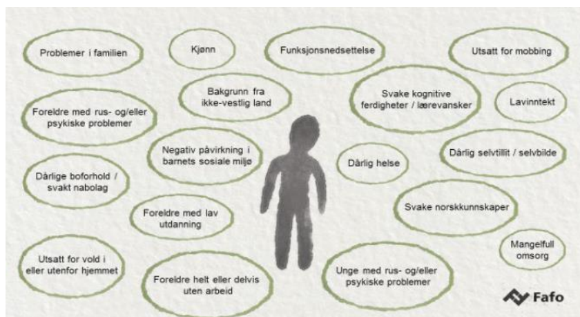
Figur 1: Illustrasjon av noen mulige faktorer som kan gi økt risiko for å oppleve utfordringer i oppveksten (Hansen et al., 2019, s 29)

I dette bildet illustrerer Hansen et al (2019) noen mulige faktorer som kan gi økt risiko for å oppleve utfordringer i oppveksten, som kan medføre flere og kanskje større utfordringer, som videre kan lede til marginalisering fra utdanning eller arbeidsliv. Flere av disse faktorene er dessuten korrelert med hverandre og kan opptre samtidig (Hyggen & Ekhaugen, 2021). Fordi de er med i pilot 0-24 Innbyggernes modell, er deltakerne av «Veien til førerkortet» i målgruppen «utsatte unge / ungdommer» 2 . Det betyr at de er utsatt for å oppleve marginalisering og utenforskap. I det videre går jeg ikke nærmere inn på ekskluderingsmekanismer fordi jeg studerer hva som kan være inkluderende, men jeg vil trekke frem at årsaker til at unge står utenfor utdanning og arbeidsliv viser seg å være komplekse og kan sjelden begrenses til én del av livet (Fyhn et al., 2021; Hyggen, 2015).