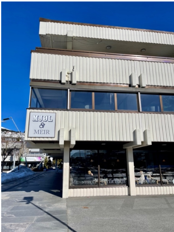
Figur 8: Mjøl og Meir, Ulstein. 25. mars 2023