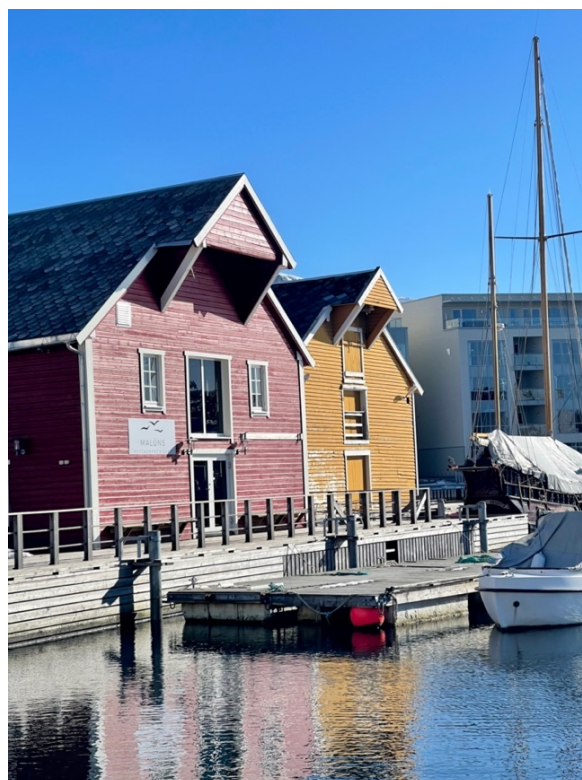
Figur 11: Sjøboder, Ulstein. 25. mars 2023