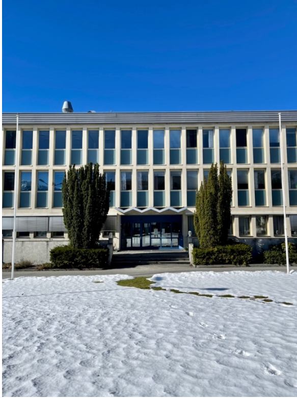
Figur 6: Ulstein Rådhus, Ulstein. 25. mars 2023