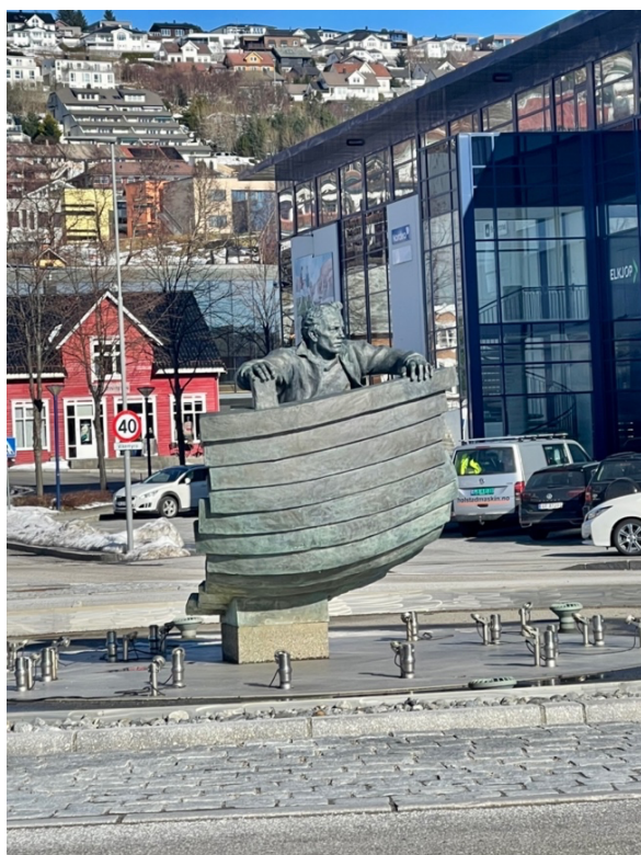
Figur 10: Rundkjøring med skipstema, Ulstein. 25. mars 2023

Informantene har også ulike oppfatninger av Ulstein sin dekorering, beplantning og rekonstruering av bygninger. Syv av informantene sier at det ikke er stort til dekorering. To informanter nevner at det finnes dekorering til 17. mai, og tre nevner at det er julelys i desember, men jeg opplever det som at informantene ikke synes dette er tilstrekkelig. Tre informanter legger spesielt vekt på mangelen av julelys. En informant trekker fram at flere statuer i byen illustrerer momenter fra skipsindustrien og synes dette er et positivt tiltak. Et eksempel på en dekorert rundkjøring med skipstema vises i figur 10. Tre informanter savner beplantning. Ved spørsmål rundt hvorvidt rekonstruerte bygninger er i henhold til kulturhistoriske tradisjoner er det bare tre informanter som kommer på eksempler. To av dem trekker fram sjøbodene i sentrum som en positiv rekonstruksjon av gamle bygg (figur 11). En informant oppsummerer spørsmålet om estetikk med å oppfordre byplanleggerne til å tenke «hvordan vil vi at byen vår skal se ut?» (informant 2).