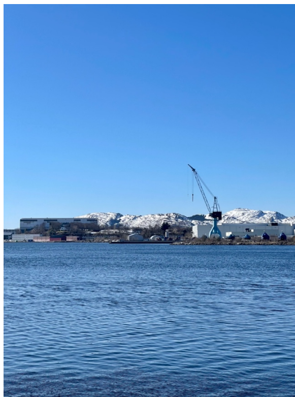
Figur 13: Landskap med kran, Ulstein. 25. mars 2023

Som redegjort for i delkapittel 3.3, presenterer Gehl (2010) lyder, lukter og det visuelle som en viktig del av sansestimuleringen, og at det er med å skape byliv. Basert på dette argumenterer jeg for at vannkanten kan være en viktig kilde til sansestimulering, og et sted hvor innbyggerne kan komme nærmere havet, lukte sjøluften og lytte til bølgene. Dette støtter argumentet fra informantene om at det er ugunstig å bygge leilighetskomplekser i vannkanten. Videre kan man argumentere for at utsikten og naturen som to av informantene nevner er en viktig del av sansestimuleringen. Det kan være negativt dersom høye bygninger i vannkanten tar dette bort fra befolkningen, slik som fire av informantene antyder. Samtidig er dette et dilemma, og som redegjort for i delkapittel 3.3 er etablering av boliger i sentrumsområdet en viktig utvikling av byen (Visnes et al., 2016).