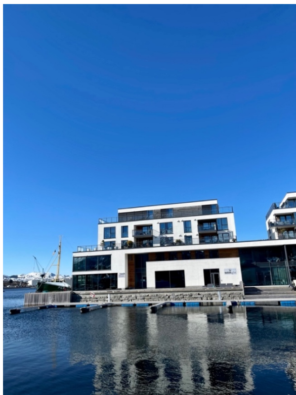
Figur 12: Leilighetskomplekser i Sjøside, Ulstein. 25. mars 2023

... det er jo utrolig flott her, de har satset veldig på sentrum og på det. Og så er det fint fra før, med strender og med, ja, vika her. Det er jo litt sånn signatur med disse kranene også, så, ja, jeg synes det er veldig fint, ja. (Informant 8)