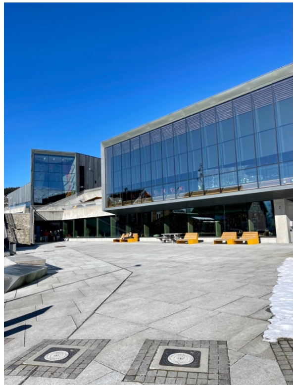
Figur 9: Ulstein Arena, Ulstein. 25. mars 2023