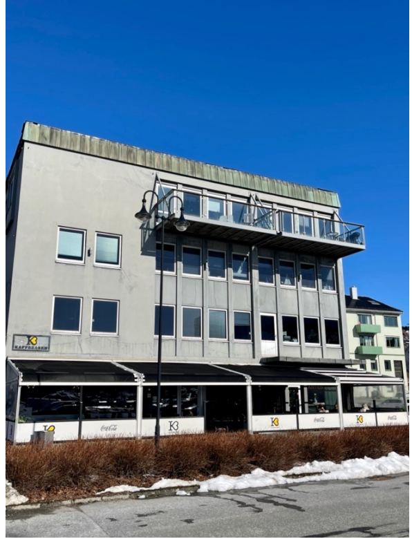
Figur 7: Kaffebaren, Ulstein. 25. mars 2023