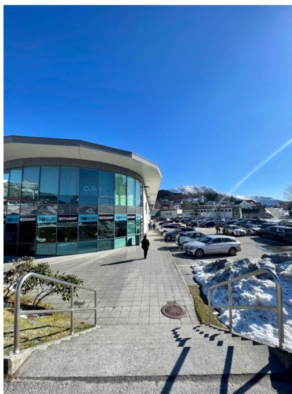
Figur 5: Amfi, Ulstein. 25. mars 2023