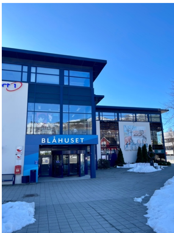
Figur 4: Blåhuset, Ulstein. 25. mars 2023

Videre har informantene ulike syn på fargesettingen i Ulstein. Fem informanter ønsker mer farger, og sier blant annet at det er mye svart og hvitt. Fire informanter opplever at fargene er nøytrale og moderne. To informanter nevner Ulstein Arena (figur 9) som et vakkert bygg med god fargesetting. Dette bygget er kjent for vakker arkitektur, og vant Statens pris for byggekvalitet i 2018 (Lund + Slaatto Arkitekter, u.å.), som redegjort for i delkapittel 2.2.