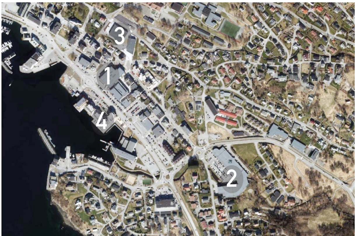
Figur 1: Kart over Ulsteinvik hentet fra Kommunekart (u.å.) med mine markeringer

For å forstå datamaterialet er det viktig å ha en grunnleggende forståelse av kommunesenteret, Ulsteinvik (Ulstein kommune, 2015), og viktige fasiliteter. Figur 1 er hentet fra Kommunekart (u.å.), og viser et flyfoto over Ulsteinvik med fire steder markert. Først de to kjøpesentrene Blåhuset og Amfi. Blåhuset er merket som «1» på bildet, og Amfi er merket som «2». Videre er Ulstein Arena, med Ulsteinbadet, Ulstein bibliotek, idrettshallen, og klatrehallen markert som «3» (Ulstein kommune, 2023). Ulstein Arena er kjent for vakker arkitektur, og vant Statens pris for byggekvalitet 2018 (Lund + Slaatto Arkitekter, u.å.). Videre er leilighetskompleksene i Sjøsidea markert som «4», som tilbyr panoramautsikt ved sjøen (Sjøsidea, u.å.).