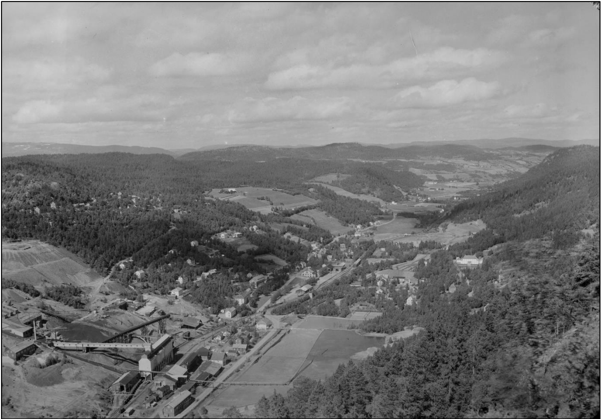
Foto 1. Løkkendalen 1939-53 fotografert mot nordvest. 114

En ting som kjennetegner en company town er avstanden mellom arbeiderne og ledelsen. Ledelsen sine boliger er skilt fra de ansattes, og direktørboligen er plassert slik at den skal ha oversikt. På bildet kan man til høyre se direktørboligen som tydelig skiller seg ut fra resten av bebyggelsen. Under direktørboligen ligger det flere villaer som ble bygget for å huse funksjonærer. Boligfeltene på Løkken Verk var spredt, og mens arbeidere med familie bodde på Bjørnli, bodde det flest enslige ungarer i Brakkan som ligger til venstre i dalsiden, mens mange av formennene bodde nede i dalen på østsiden av Raubekken. Dermed var det også et fysisk skille mellom ledelsen og arbeiderne på Løkken Verk, med Raubekken. Det var også anlagt funksjonærboliger på Bjørnli, der funksjonærene bodde på Torvet i boliger som var større enn arbeidernes boliger. Selv om de fleste boligene ble bygget på 1920-tallet var det fortsatt de samme boligene som huset funksjonærer og arbeidere under andre verdenskrig. Direktøren og formennene bodde ikke i samme område som de ansatte, og det var også stor forskjell på boligene deres.