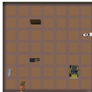
Figur 2. Fysisk lamineret rubriksbræt

Derefter vil deltagerne blive præsenteret for den virtuelle have i 3D, og de vil have 1 minut til at gå ind i lokalet med gulvet delt i 49 felter med de seks objekter placeret vilkårligt (se Figur 1). Deltagerne vil nu skulle gå rundt i lokalet og huske, hvilke objekter der er placeret hvor, og i hvilken retning de vender. Når dette minut er gået, vil der igen vises en sort skærm i 1 minut. Deltagerne vil nu blive bedt om at tage VR-brillerne af og udfylde en Odd-Even test, som vil have til formål at distrahere deltagerens hukommelse. Herefter vil deltagerne skulle bruge det fysiske laminerede rubrikbræt foran dem til at placere de seks objekter i de rigtige