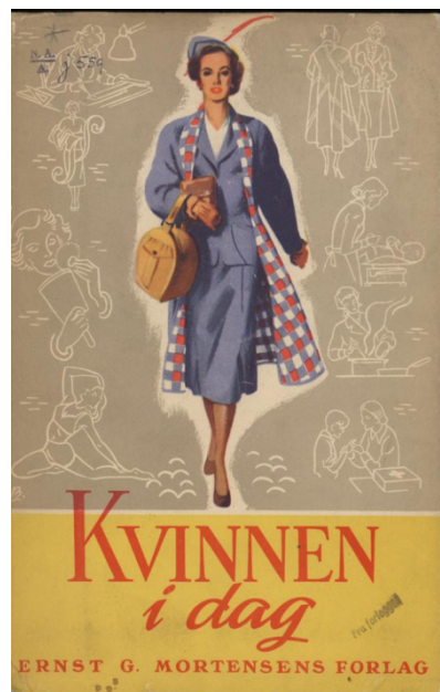
Figur 1: Framsiden til Kvinnen i dag (Ernst G. Mortensens Forlag, 1950)

Boken uten omslag har en mørkerød farge, som kan kjennes igjen som en leksikonbok eller en fagbok. Å kategorisere Kvinnen i dag som ei fagbok/leksikonbok er en korrekt slutning, da den er lagt opp med faglig begrunnelse på rådene den gir og er skrevet av eksperter. Utseende av boken, samt tyngden til den, forteller at dette er ikke en bok en tar med seg ut av huset. Det er heller ikke en bok som en komfortabelt sitter i godstolen og leser. Dette er en bok en åpner for å slå opp et tema. I hvert kapittel kan en finne uthevede ord som trekker blikket til et undertema i hvert kapittel. I kapittelet «Kvinnen som mor» kan en finne overskriftene utstyr, mat hos mor, vektøkning og kunstig ernæring. 40 Dermed kan leseren lett bla opp til det temaet de trenger i øyeblikket.