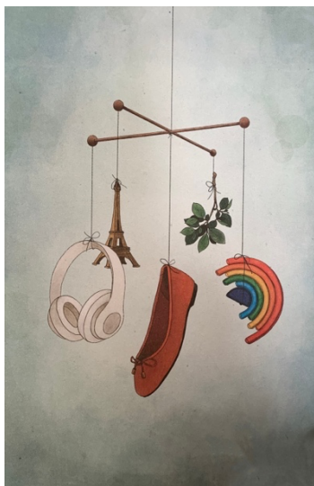
Figur 4: Bildet som følger med kapittel 4. (Vigdel (2022): 64)

Hvert kapittel kommer med et bilde som skal representere denne perioden av morsrollen. Eksempler på dette er moren som står med et barn i bæresele for kapittel 1 80 og kapittel 8 81 som er en kontorstol mellom et kjøkkenbord og arbeidspulten. Bildene viser en sinnsro som Vigdel selv prøver å strekke seg etter i kapitlene. Øyeblikkene som en finner i bildene er ikke perfekte øyeblikker, men heller et ønske om å finne sinnsroen i det uperfekte. At disse øyeblikkene er verdt å stoppe opp for å nyte.