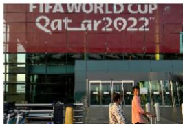
Figur 2. Side 1 på Al Jazeera Engelsk.