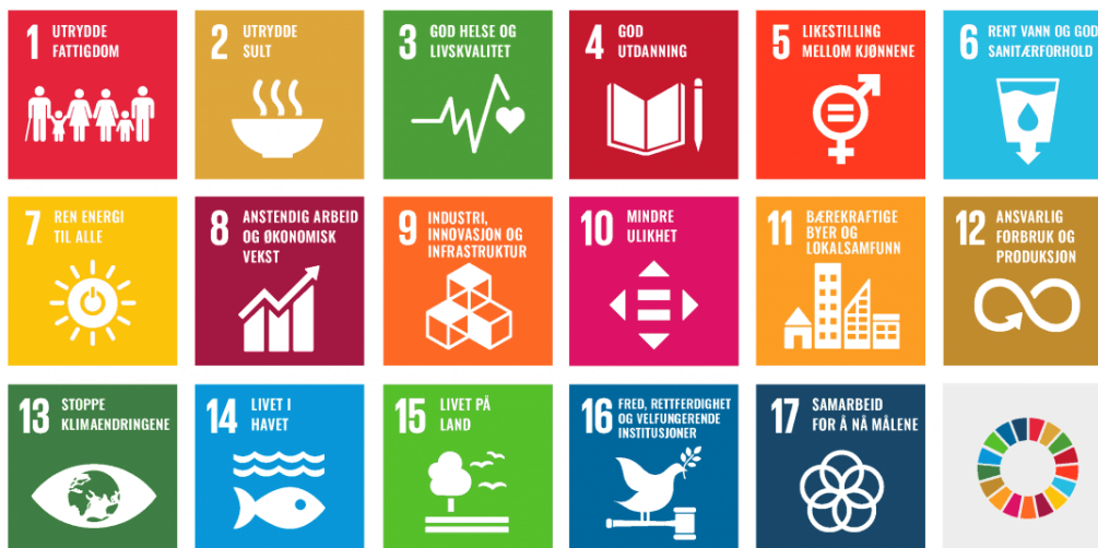
Figur 1: FNs bærekraftsmål (FN-sambandet, 2021)

I 2000 vedtok alle verdens land tusenårsmålene. Dette var åtte spesifikke mål for å bekjempe fattigdom, tidsfristen for målene gikk ut årsskiftet 2015/2016 (Norad, 2015). Disse målene ble erstattet av FNs bærekraftsmål. Dette er 17 konkrete mål, med totalt 169 delmål. Disse skal fungere som et rammeverk for å bekjempe ulikhet, utrydde fattigdom og stoppe klimaendringene innen 2030. De tre aspektene, sosial, økonomisk og miljømessig bærekraft er alle representert i bærekraftsmålene. Målene er illustrert i figur 1.