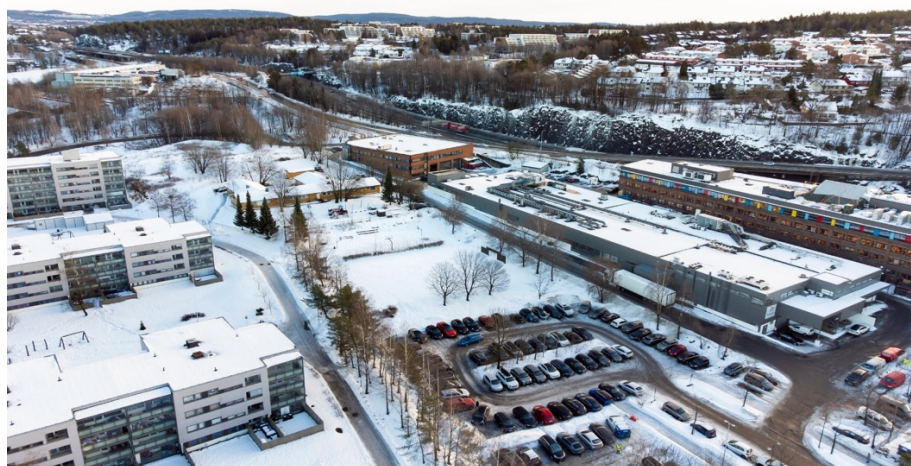
Figur 4 Byggeområdet til Furuset Village (Thorgersen, 2022)

Informant OBOS: (...) Altså det er alltid noen som er skeptisk mot alle utbyggere. «Skal dere komme hit og tjene penger, og ødelegge Furuset liksom». Ja, vi føler ikke at vi ødelegger noe. Det er jo en forlatt parkeringsplass der i dag som kan gjøres mye hyggeligere, men man skal være veldig var da for hva de rundt mener. Vi kommer inn i deres boområdet, deres nærmiljø (...).