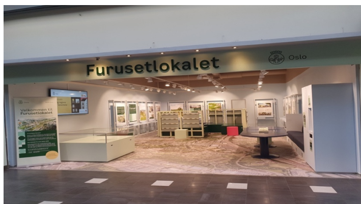
Figur 3 Furusetlokalet (Oslo Kommune, u. å)

I lys av interessevekking og innrulling, har dette kapitlet vist at samarbeid med Bydel Alna og OBOS har vært viktig for å skape mer interesse fra lokalbefolkningen. I denne sammenheng har interesseorganisasjoner på Furuset vært viktige aktører for at OBOS skulle få mer informasjon om Furuset. Dette har gjort at flere aktører i bydel Alna har innrullert seg, og kommet med innspill til design og bruk av byggeprosjektet. På denne måten har OBOS fått kontakt med andre mennesker i lokalbefolkningen. Et godt eksempel er bruken av lokalet på Furuset senter der innbyggerne har fått mulighet til å komme med interesse og innspill til prosjektet, ved hjelp av innspillsboks og QR-kode. Dette er et eksempel på det Latour (1987) kaller aktanter (ikke menneskelige aktører) fordi de er ting som har handlekraft som får aktørene i denne prosessen til å handle, noe som i denne prosessen betyr at aktørene kommer med innspill til OBOS ved å bruke nettside og innspillsboks (Latour, 1987).