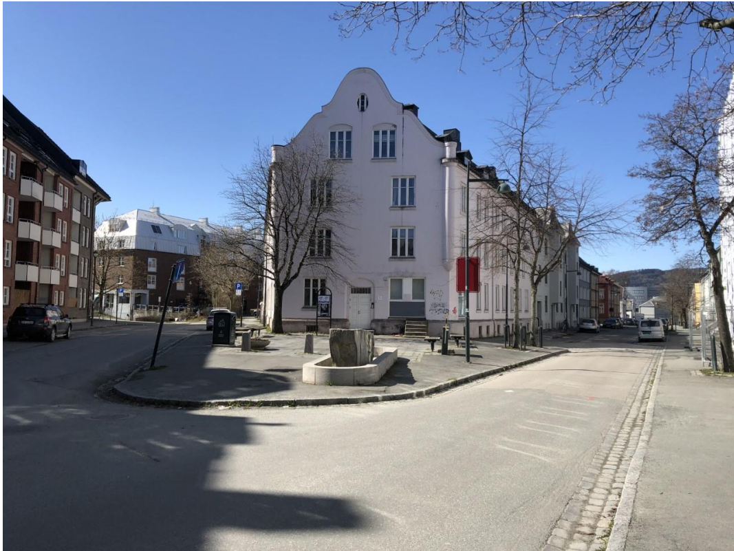
Møteplassen mellom Østersunds gate og Ulstadløkkveien på Lademoen.