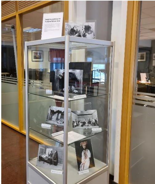
Den ferdige utstillingen.