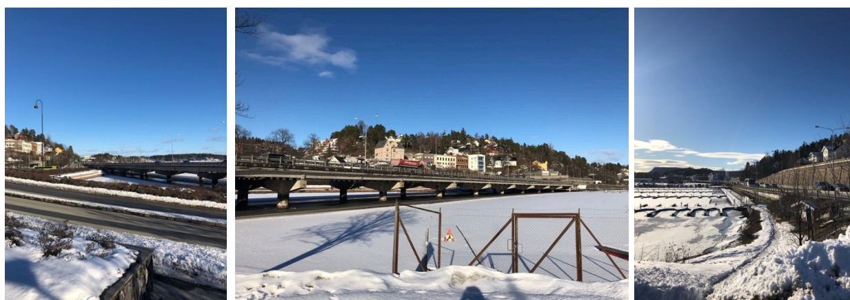
Figur 3 E18 som planlegges å legges under bakken, med nåværende lokalvei liggende bak.

Ifølge deltaker 1 har det vært snakk om at E18 skal legges i tunell i 20-30 år. Men de første konkrete planene ble presentert i kommuneplanen av 2014 for Bærum kommune. Her sto det at E18 planlegges å legges i tunell, og at det må komme en lokalvei langs sjøfronten i denne sammenheng. I denne kommunedelplanen ble det stilt krav om felles planlegging for Statens vegvesen og Bærum kommune for byplangrep for omleggingen av E18 og utviklingen av denne lokalveien. Hittil i planprosessen har det ifølge deltaker 1 blitt utarbeidet et planprogram for hele sjøfronten, mens reguleringsplaner for området ikke er fastsatt ennå.