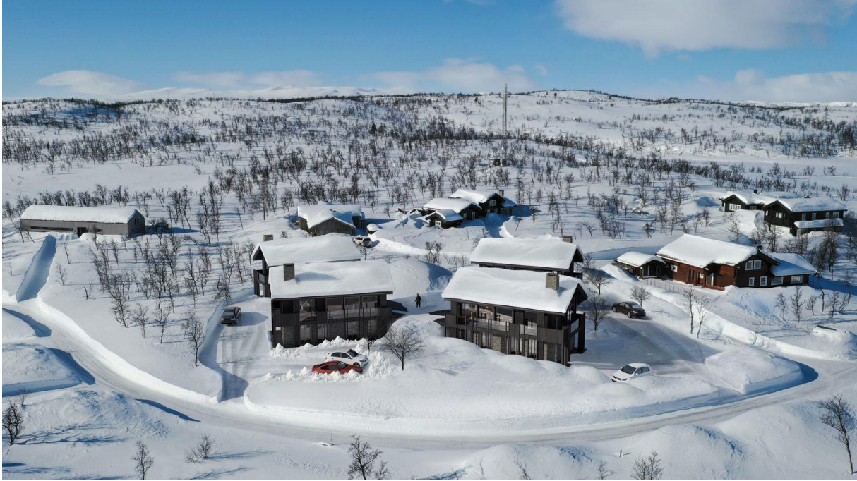
Figur 1: Bilde viser eit hyttefelt på Geilo.