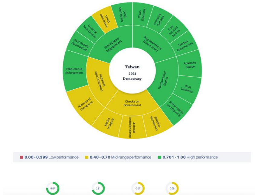
Figur 2 – Taiwans demokratimål. (GSoD, 2022)