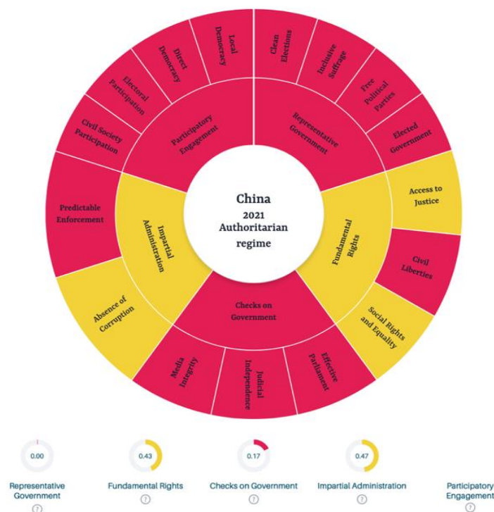
Figur 3 – Kinas demokratimål. (GSoD, 2022)

Forskjellene mellom Taiwan (figur 2) og Kina (figur 3) ut ifra Global State of Democracy Initiatives demokratimålinger fra 2021. I disse målingene blir det målt representativ regjering, tilgang til rettighet, sjekk av myndigheter, upartisk administrasjon og deltakende engasjement. (GSoD G. S., 2022)