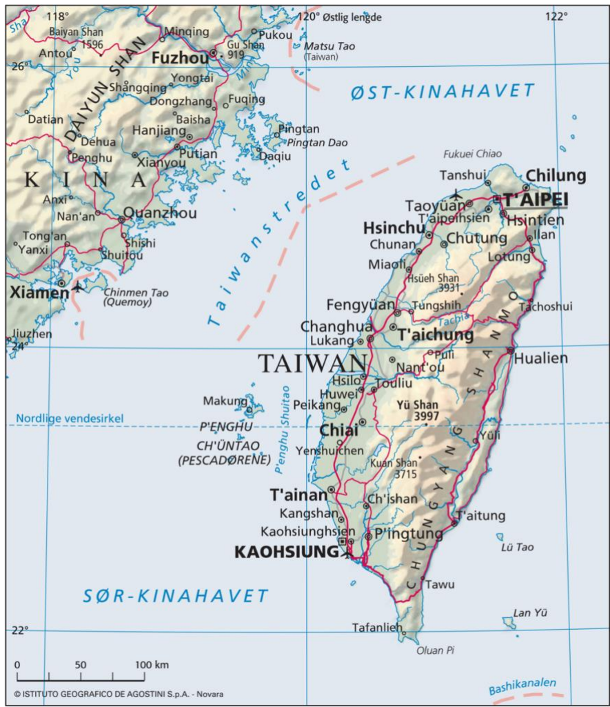
Figur 4 – Taiwanstredet (Store norske leksikon, 2020).

I forklaringen til Kina om hvorfor de ønsker kontroll over Taiwan, bruker Kina historien om tidligere skam og ønske om fremtidig rettfærdiggjørelse. I denne fortelling blir det uttrykt at Taiwan var et resultat av svakhet og kaos i Kinas nasjon, og at det vil kunne bli løst om nasjonene gjenforenes. (Rennie, 2022) Et argument Xi bruker for gjenforening er at kinesere og taiwanere er av samme folk. Grunnlaget til Xi i dette argumentet kommer fra historien der Kuomintang flyktet fra fastlandet til øya, og derfor stammer alle innbyggere i Taiwan ifølge Xi fra Fastlands-Kina. (Marinaccio, 2022)