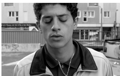
Bilde 5: Filmens første frame. Said foran politiet.

Tatt fra boken Film og fortelling av Audun Engelstad kan fortellinger gi inntrykk av å fortelle «alt», slik at publikum får med seg den fulle hendelsen. Det er derfor underforstått at relevans er et kriterium, for å eksponere det regissøren mener er kritisk å ta med (Engelstad, s. 174). I La Haine velges det å utelate de to hoved hendelsene, som kanskje en annen regissør hadde valgt å beholde. Mathieu setter startpunktet etter hoved begivenheten og slutter med en åpen slutt, midt i det «high point». For han, er de rett og slett ikke relevant for å formidle det budskapet som ønskes. Han ville forstå hvordan ungdommen med mangfoldig bakgrunn gang på gang havnet i livstruende situasjoner. Kanskje det kun var rene tilfeldigheter? Kanskje de kjemper om å overleve hver dag? Kanskje det ikke handler om den store begivenheten? Kanskje dette var uunngåelig?