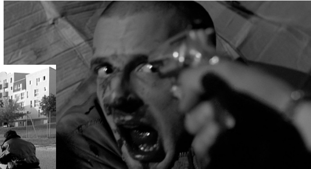
Bilde 4: Mathieu Kassovitz som 'skinhead'

Tatt fra boken Film og fortelling av Audun Engelstad kan fortellinger gi inntrykk av å fortelle «alt», slik at publikum får med seg den fulle hendelsen. Det er derfor underforstått at relevans er et kriterium, for å eksponere det regissøren mener er kritisk å ta med (Engelstad, s. 174). I La Haine velges det å utelate de to hoved hendelsene, som kanskje en annen regissør hadde valgt å beholde. Mathieu setter startpunktet etter hoved begivenheten og slutter med en åpen slutt, midt i det «high point». For han, er de rett og slett ikke relevant for å formidle det budskapet som ønskes. Han ville forstå hvordan ungdommen med mangfoldig bakgrunn gang på gang havnet i livstruende situasjoner. Kanskje det kun var rene tilfeldigheter? Kanskje de kjemper om å overleve hver dag? Kanskje det ikke handler om den store begivenheten? Kanskje dette var uunngåelig?