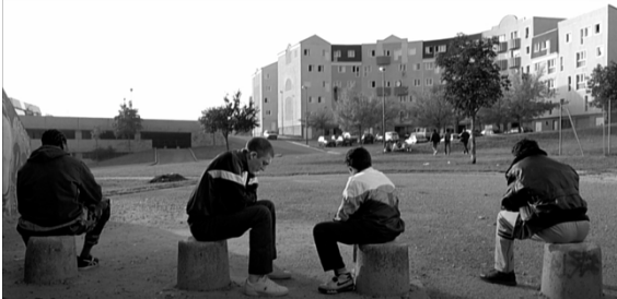
Bilde 3: Klokkeren 14:12 i filmen

karakterene. Men dette er virkeligheten for de fleste ungdommer i en drabantby. De har ingen jobb å møte opp til og heller ikke en utdanning å være en del av.