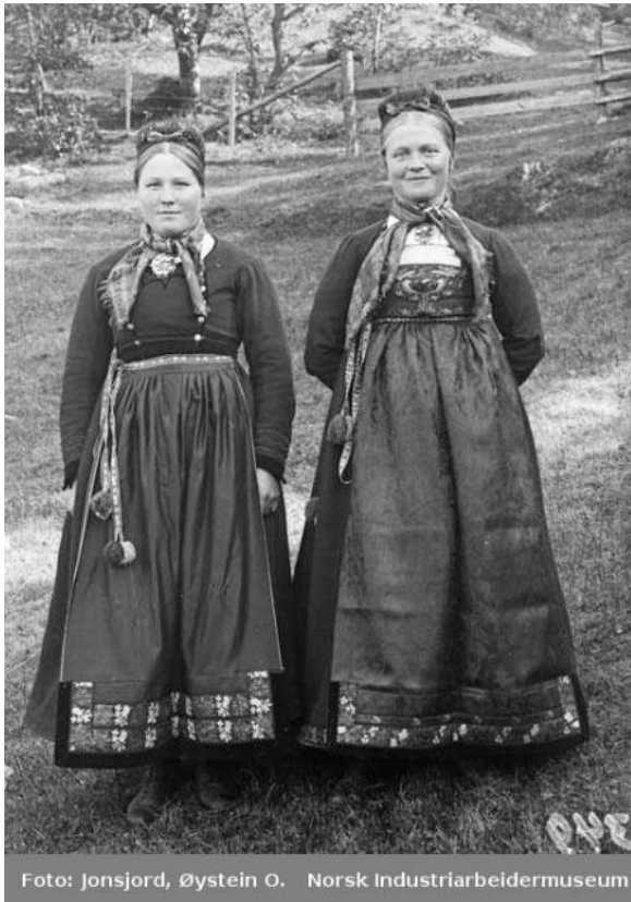
FIGUR 2 FOLKEDRAKT FRA TINN. HENTET FRA DIGITALT MUSEUM 25.04.23