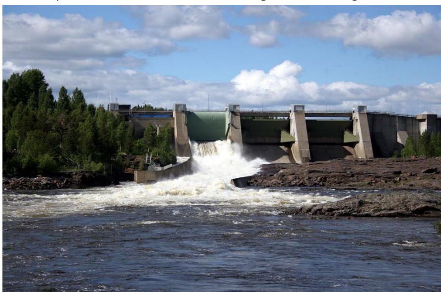
Stornorrfors dam, Umeå.

Vi har studert gjennomføring av miljøtiltak i regulerte elver i vannkraftproduserende land som er sammenlignbare med Norge.