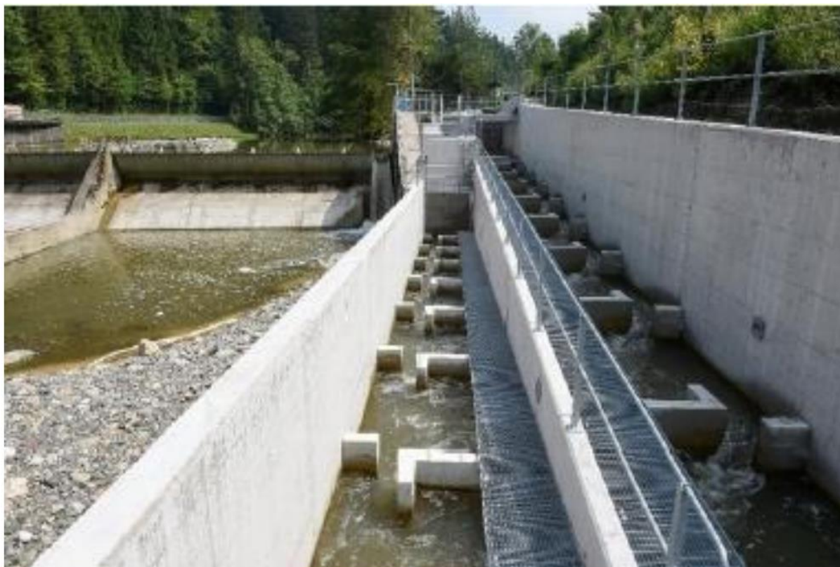
Fiskepassasje ved Hüttener Wehr i elven Sihl, Zürich kanton - Sveits.

I tillegg er nasjonale retningslinjer for utpeking av Sterkt Modifiserte Vannforekomster (SMVF) samt definering av Godt Økologisk Potensial (som et mindre strengt miljømål), formulerte i EU landene. For øyeblikket finnes det imidlertid ingen felles definisjon eller klar metode om hvordan man identifiserer SMVF.