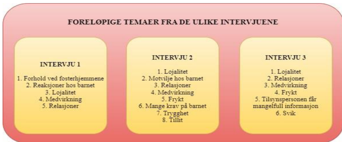
Figur 1. Foreløpige temaer fra første analysetrinn

Under første del av analysen er hensikten å bli kjent med materialet. Man leser gjennom transkripsjonene og forsøker å danne seg et helhetsbilde, samtidig som man vurderer mulige temaer som kan være aktuelle for den videre analyseprosessen (Malterud 2017:99). Etter å ha lest gjennom samtlige transkripsjoner forelå følgende foreløpige temaer som intuitivt hadde vekket oppmerksomheten: