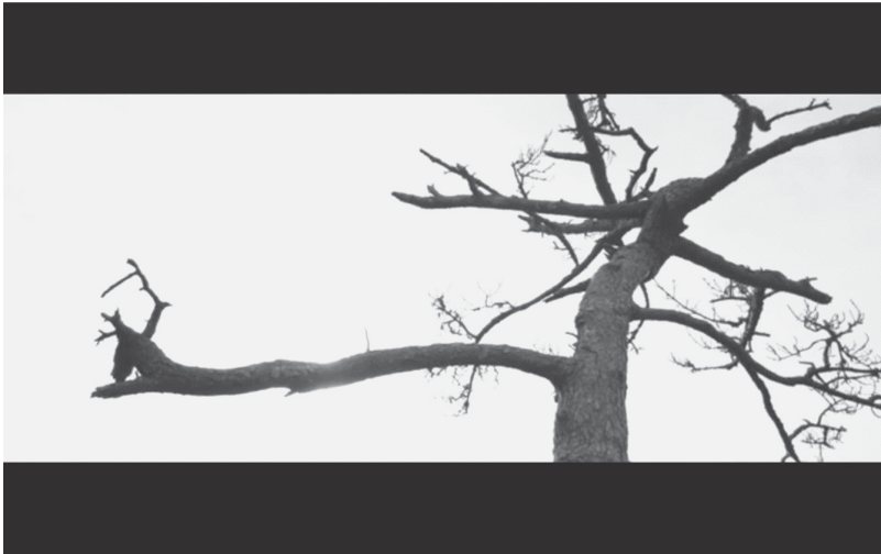
Abb. 3: Doris Dörrie, GRÜSSE AUS FUKUSHIMA (Still © 2016 Majestic)

Konstitutiv für den gesamten Film ist eine Mischung fiktionaler und dokumentarischer Anteile. Zu seinen thematischen Oppositionsfiguren gehört ein Kontrast zwischen dem agrarischen und dem technoiden Japan ebenso wie zwischen Satomi und ihrer Tochter Toshiko (Aya Irizuki), die als eine Art neue Geisha zu Elektromusik in Tokio auftritt. 6