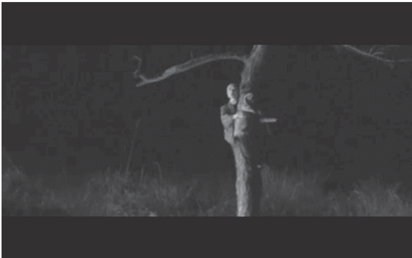
Abb. 4: Doris Dörrie, GRÜSSE AUS FUKUSHIMA