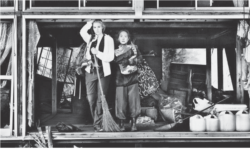
Abb. 1: Doris Dörrie, GRÜSSE AUS FUKUSHIMA