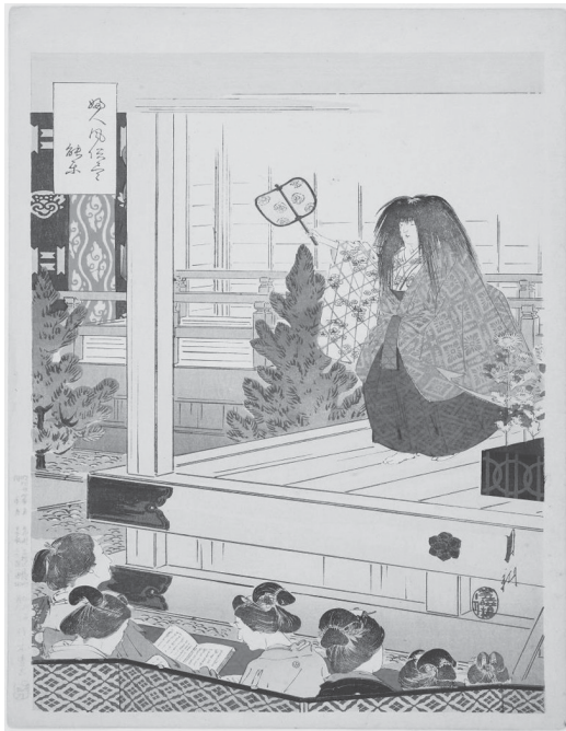
Abb. 2: Ogata Gekkō, Nogaku [Im Nō-Theater] (Holzschnitt, 1891, gemeinfrei, Quelle: www.dh-jac.net/db/nishikie/arcUP0543/portal/ [letzter Abruf 10.3.2022])