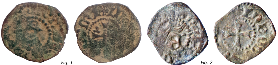
Figur 1. Kobbersterling fundet i eller nær ved Zierikzee, 15-17 mm & 0,85 g. Figur 2. Kobbersterling fundet i Zutphen.