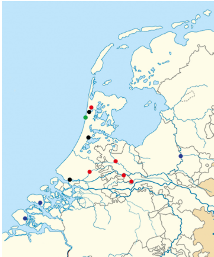
Figur 5. Kort over Nederlandene (med middelalderlige grænser og kystlinje) med fund af Erik af Pommern mønter.

I alt er 13 sikre Erik af Pommern-mønter registreret i Nederlandene, hvortil endnu en hulpenning måske skal føjes. Intet andet land uden for Norden kan fremvise flere fund. Imidlertid kan dette faktum ikke uden videre bruges til at konkludere, at disse mønter var mere i omløb i Nederlandene end i andre ikke-nordiske områder. Hvis man vil sammenligne fundbilleder mellem lande på et korrekt grundlag, kræves det, at alle fund bliver registreret, og det er langt fra tilfældet. Selv i Nederlandene med en årtier-lang tradition for aktiv fundregistrering, en liberal metaldetektorpolitik og en veludbygget national database kunne antallet af fund uden alt for stor indsats ret let fordobles i forhold til NUMIS. Derudover kan vi være rimeligt sikre på, at en ukendt andel af fundene ikke bliver anmeldt og registrerede, så der er sikkert endnu flere Erik af Pommern mønter i Nederlandene end dem, der fremgår af tabel 1.