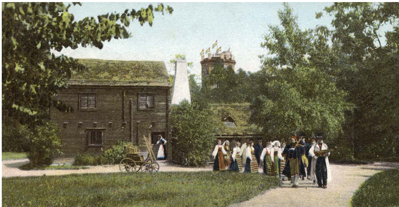
Ett dansgille iklädda olika nationaldräkter avgår från Kyrkhultsstugan på Skansen. Detta vykort är ett av tusentals som sändes runt om i världen och spred nyheten om Skansen som ett levande friluftsmuseum och en ny museiform.