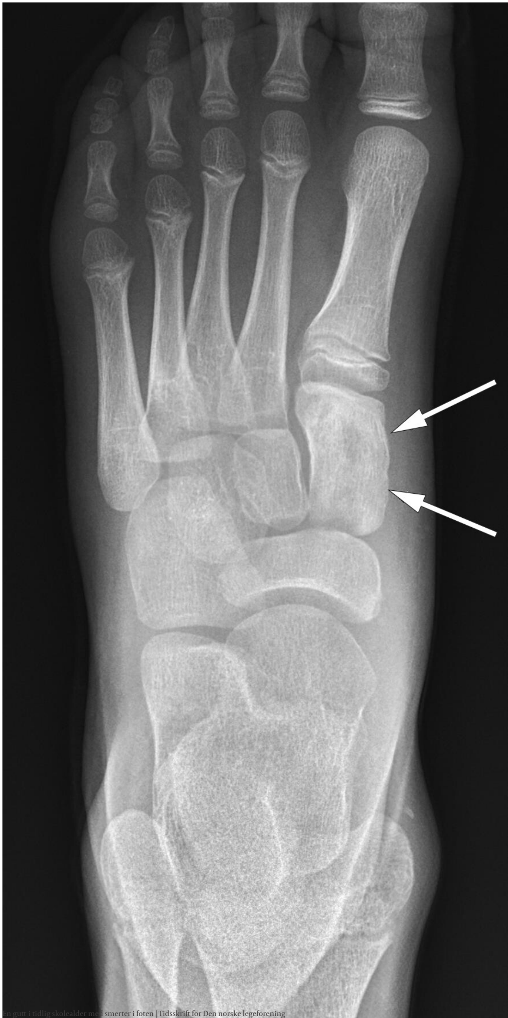
En gutt i tidlig skolealder med smerter i foten | Tidsskrift for Den norske legeforening