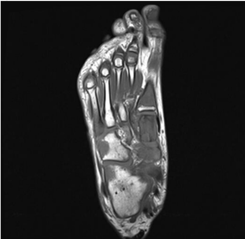
Figur 2 T1-vektet MR av høyre fot. Legg merke til signalforandringer i hele første metatars og proximale femte metatars samt flekkvise signalforandringer i fotrotsbeina.