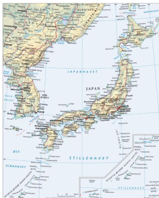
Kart A Japan

Som vist på kartet nedenfor, er Japan et øyrike som består av fire store øyer og over seks tusen mindre øyer som for det meste er ubebodd. 19