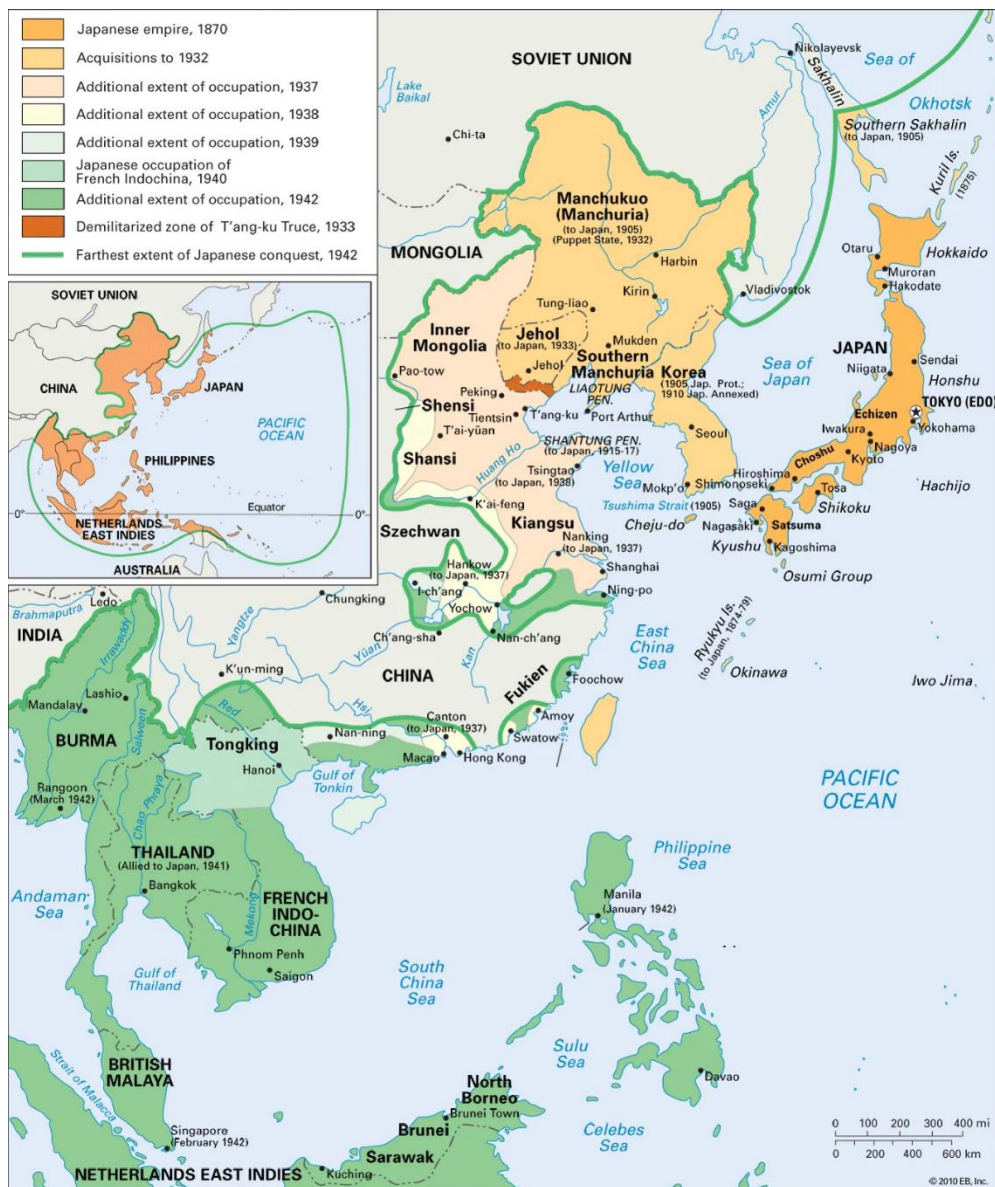
Kart B Japans ekspansjoner, 1932-1942