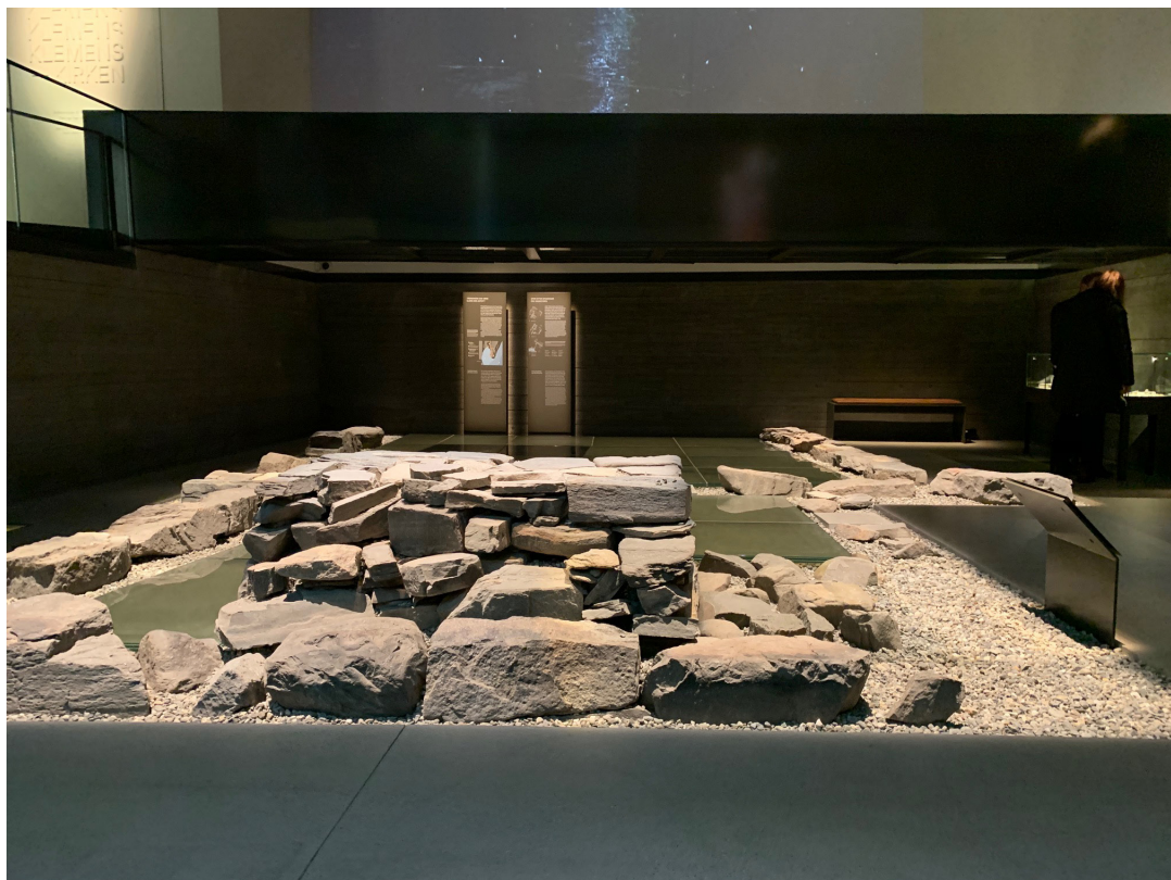
Figur 3. Kirke B. Til høyre for alterfundamentet ser vi de få steinene som er igjen av alteret i kirke A.

pilgrim podcast fra juli 2021 (Collin 2021). Her intervjues prosjektlederen for utstillingen, hvor han gis anledning til å fremme sin klemenskirketolkning helt uten å bli møtt med kritiske refleksjoner og spørsmål. Podkasten lar seg rett og slett bruke som mikrofonstativ. Utgravningsrapportens forbehold på sentrale/kritiske punkter innhylles altså nå i et slags glemselens slør, og står i fare for å forsvinne helt. Videre må påstandene fra NIKU forstås som diskursive utsagn (forstått som kunnskapsdannende), og ikke bare tilfeldige ytringer fra hvem som helst. Dette fordi de fremmes fra spesielle posisjoner; av direktøren som snakker på vegne av organisasjonen og av lederen av utgravningsprosjektet. Denne mekanismen er egnet til å styrke Klemenskirken som diskursivt objekt. Slik fremstår