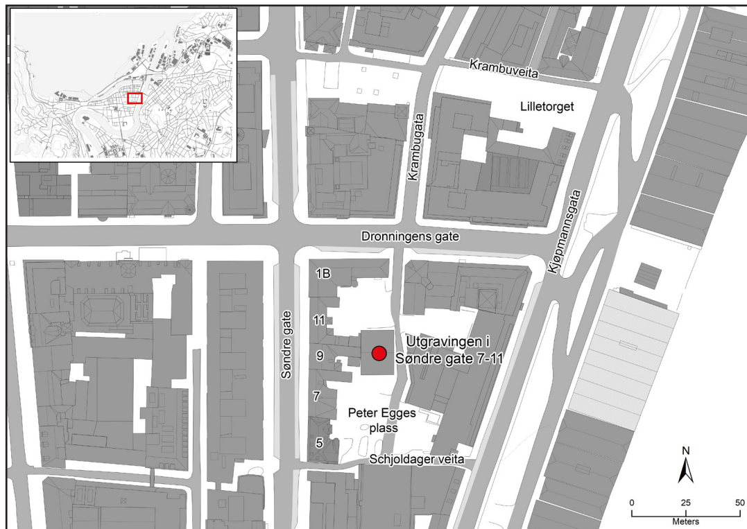
Figur 1. Område for utgravningene i 2016–2017.

dette kunne være stedet hvor Olav, ifølge Snorre ble helgenkåret i 1031 e.Kr. Det ble åpenbart at både NIKU og Riksantikvaren hadde forhastet seg ved å foregripe utgravningens resultater, ikke minst gjaldt dette konklusjonene i Riksantikvarens utstilling som bastant gestaltet både Olav Haraldssons Klemenskirke og funnstedet som «stedet der alt startet». Men man ga ikke opp tanken om at det likevel på et vis kunne handle om Olav Haraldssons Klemenskirke. Dermed gikk man langt (også i rapporten) i retning av å konstruere det jeg vil kalle Klemenskirken 2.0 . Bakgrunnen for dette var at kirkeruinen i Søndre gate 7–11 i sin eldste fase (kirke A) består av gjenbrukt materiale fra en eldre bygning. Dette materialet kan dateres til tidlig 1000-tall. Man mener å sannsynliggjøre at denne bygningen representerer en eldre kirke som har blitt flyttet helt eller delvis til stedet, og prøver så å avgrense