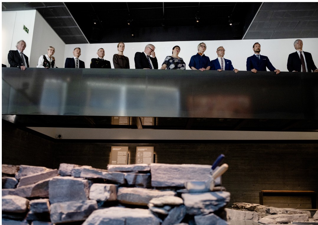
Figur 2. Utstillingsåpning mai 2019. Med bl.a. HKH Kronprins Haakon og daværende klima- og miljøminister Ola Elvestuen. Foto: Marthe Amanda Vannebo. ©Adresseavisen. Gjengitt med tillatelse fra Adresseavisen.

variant av Olav Haraldssons Klemenskirke som man mener er mer i samsvar de arkeologiske resultatene, versjon 2.0.