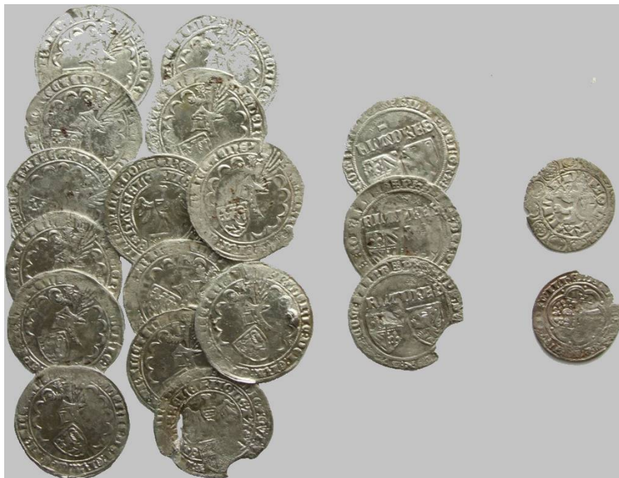
Figuur 1 – De vondst Zwartewaterland 2017 (schaal 90%)

Ongeveer 50 meter van de vondstlocatie zijn overigens twee aan elkaar geclusterde munten gevonden, een Tourse groot op naam van 'Philippvs Rex' (hoogstwaarschijnlijk een contemporaine vervalsing dan wel navolging) 1 en een Prager groschen op naam van Wenceslas IV (1376-1419) (PAN nummers 18397 en 18398; zie voor de toeschrijving aan Wenceslas IV: Emmerig 2009: 154). Deze lijken geen deel uit te maken van de vondst, ofschoon de laatste munt qua datering zou passen.