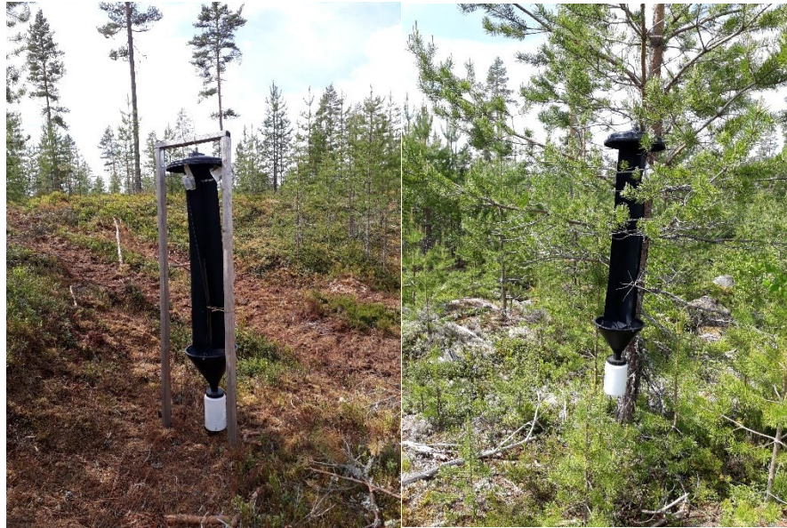
Figur 2. Felle 1A (TH) og 1B ved Mosjøen