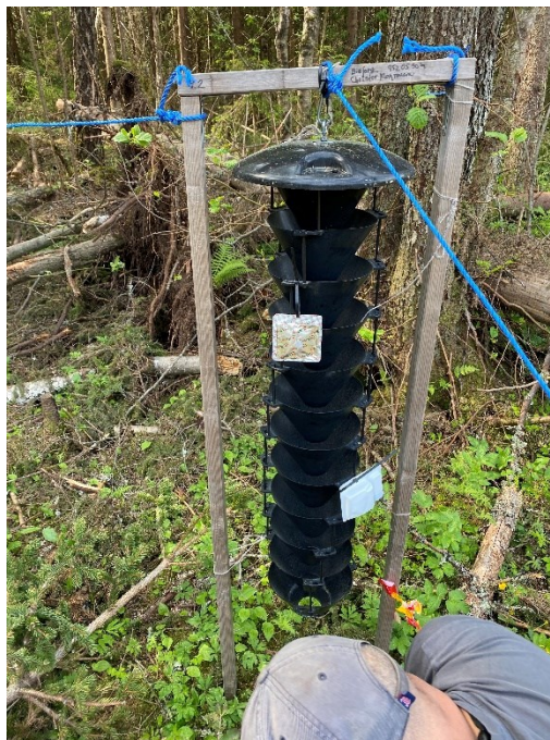
Figur 1. Stor multifunnel trap brukt til Monochamus fangst i Bærum

Felt 2 felle 2 (på bakken) Steinsskogen, Bærum 59°59'00.0"N 10°28'54.9"E