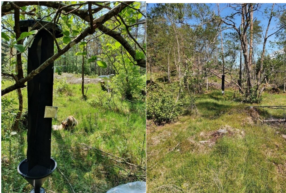
Figur3. Felle 1 (TV) og 2 i Hatlestrand