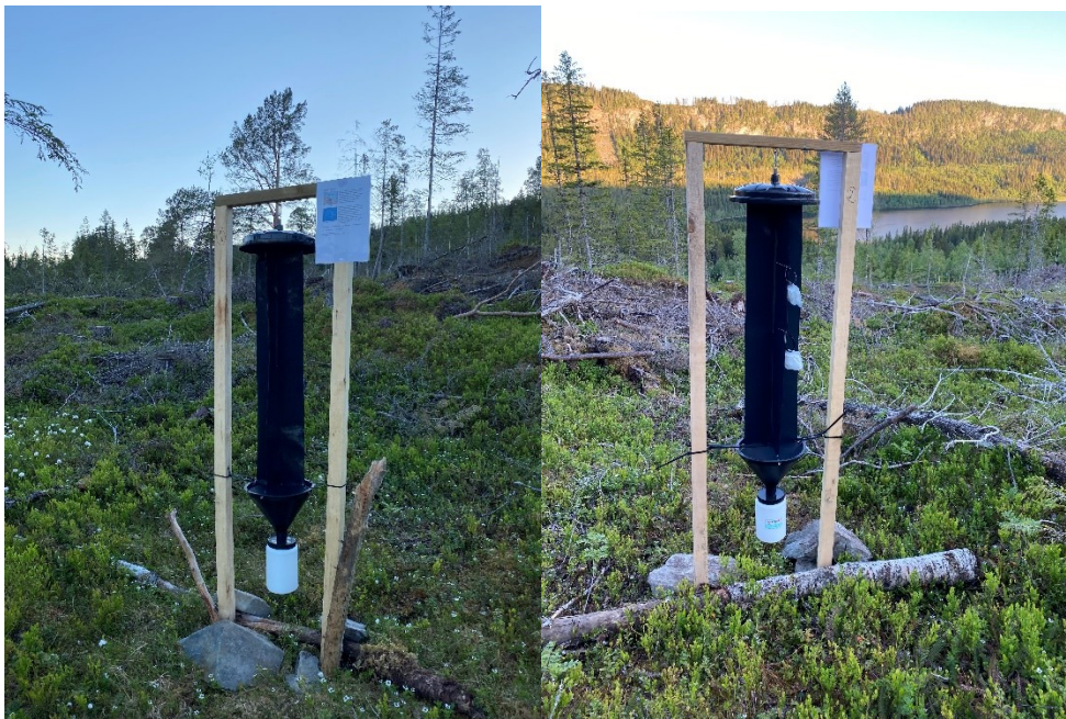
Figur 5. Felle nr. 1 (TV) og 2 ved Romsjøen, Stjørdal

Felle 2: 63°24'38''N, 11°6'8''Ø (Elvarli, N-T, 250 moh)