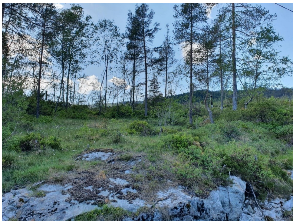
Figur 4. Felle feltet på Oma

Felle 1 (60.229526° N, 5.982657° E) (Brukes for feltet, fellene ganske nærme hverandre)