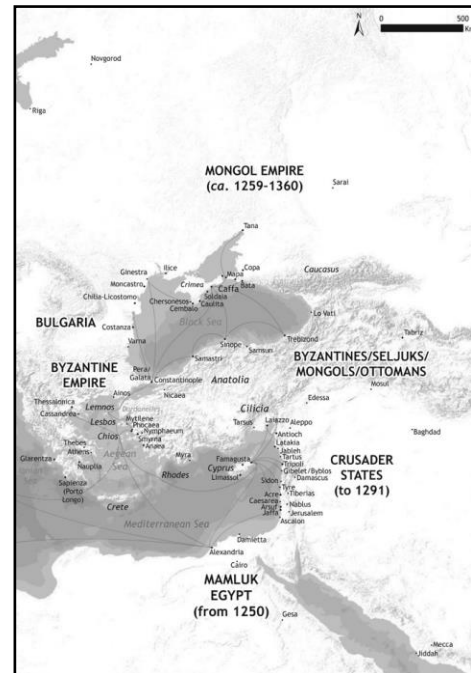
Figur 1: Middelalderens østre-Europa, østre Middelhavet og Midtøsten.

Nedgang og politiske kriser i den genovesiske kommunen på 1300-tallet lar seg derfor forklare med fraksjonalisme og rivaliseringer mellom byens sosiale grupper. Årsaken til disse kontinuerlige problemene skyldtes kommunens mangel på et fastsatt politisk rammeverk og