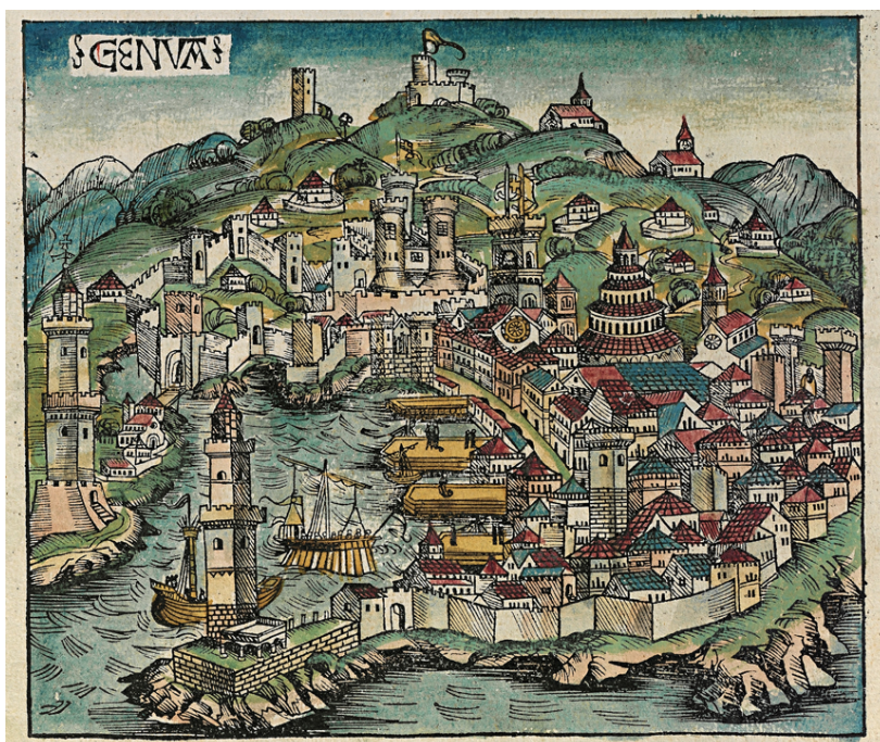
Byen Genova fra et tresnitt i Nuremberg krønike, 1493.