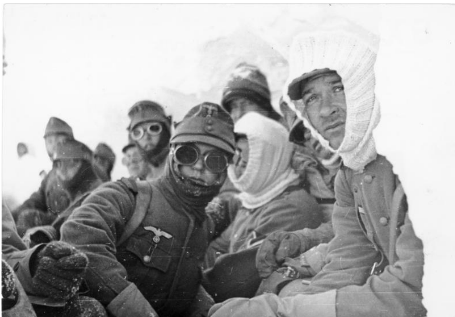
Bergjegere ved Narvik.