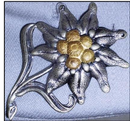
Figur 2: Edelweiss fra en bergjegeruniform

Vinteren 1914 opprettet det bayerske krigsministeriet ved hjelp av det tyske skiforbundet et skiløperkorps som kunne settes inn på forskjellige fronter. 57 I løpet av første verdenskrig deltok alpekorpsset ved flere fronter, derunder Serbia, Romania og Isonzo, hvor også senere Wehrmacht-generaler som Rendulic tjenestegjorde. 58 Senere kjent som Deutsches Alpenkorps , ble korpset etter kampene mot italienske styrker i Dolomittene forært edelweiss-insigniet av østerrikske avdelinger i takknemlighet for støtten.