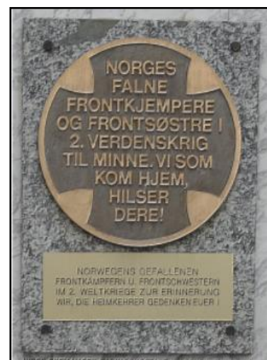
Figur 10: Minnetavle over norske frontkjemper.

Der minnstedet ved Mittenwald var utelukkende for bergjegere har dog Ulrichsberg en bredere profil, om enn med bergjegerne som sentrale aktører, blant annet i at bergjegerveteranen Blasius Scheucher var opphav for idéen om minnesmerket på Ulrichsberg. 364 Ulrichsberg ble brukt ikke bare av bergjegere, men inkluderte soldater fra andre avdelinger, inkludert Waffen-SS, representert i form av HIAG ( Hilfsgemeinschaft auf Gegenseitigkeit der Angehörigen der ehemaligen Waffen-SS ). 365 Foreningen var gjennom denne bredere deltakelsen mer ideologisk ladet enn Mittenwald og det nasjonalsosialistiske uttrykket var eksplisitt i at det i æreslunden ved Ulrichsberg ble