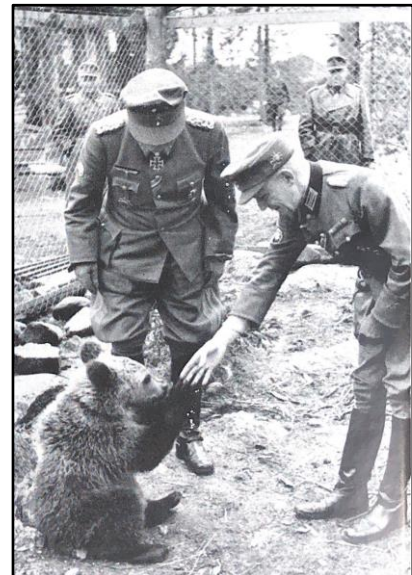
Figur 7: Bergjegere og en fanget bjørnunge. Foto: Lothar Rendulic, Gekämpft, Gesiegt, Geschlagen (1952)

Peter Lieb og Christoph Nübel drøfter hvordan sosiokulturelle forforståelser var viktige for soldatenes krigserfaringer, noe som understreker de særegne beskrivelsene av Polarfronten. 284 Siden bergjegerne både under og etter krigen slet med å oversette det alpine til det polare, tvang andre strategier seg frem i beskrivelsen av Polarfrontens klimatiske og naturlige forhold. Den feilslåtte oversettelsen av det alpine til Polarfronten førte til at soldatene opererte med referanser mer preget av den tidligere mytiske oppfatningen av det nordlige, der kampene ble fortolket som liggende innenfor rammene av det ukjente, isolerte og fremmedgjørende. Som Sotaniemi beskriver i sin undersøkelse av den østerrikske oppfatningen av Polarfronten, forekommer i intervjuer av tidligere veteraner beskrivelser av fronten og fronthoppholdet ord som «reise» eller «passasje», noe som setter krigserfaringene i et skinn av eventyr og odysse. 285 Denne fortolkningen speiles også i navnet på Ruefs divisjonshistorie: Odysse einer Gebirgsdivision (1976).