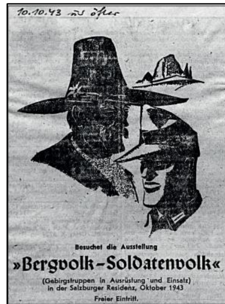
Figur 6: Avisreklame for utstillingen «Bergvolk-Soldatenvolk», Oktober 1943

Som i utgangspunktet apolitisk kunne alpinismen også anvendes i pleien av det kritiserte maskulinitetsuttrykket som kom ut av første verdenskrigs skyttergraver. I filmer som Luis Trenkers Berge in Flammen (1931) fremstod fjellklatrerne som soldater i kamp med naturen, der klatregruppen ble et mikrokosmos og bilde på folkefellesskapet utsatt for ytre fiender. 244 Hos Trenker er fjellklatrerens maskulinitet uavhengig av ytre æresbevisninger, den viser seg i hans ferdigheter og evne til å mestre naturen. Denne særlige identiteten tillagt og konstruert av bergjegerne har fått et uttrykk i Heeresbergführer -merket, en egen medalje (paradoksalt nok) for de tyske bergavdelingene. Merket ble utdelt uavhengig av rang og skulle kun reflektere soldatens evne til å føre og te seg i alpine og ekstreme naturforhold. At kun omtrent 380 ble utdelt, gjør den til en av de sjeldneste utmerkelsene i Wehrmacht. 245