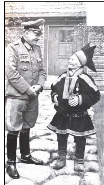
Figur 4: Lothar Rendulic og "Samefyrsten".

Soldatenes uvisshet og blandede forhold til samene, distansert fra europeisk kultur, kommer til syne i bildematerialet fra fronten, som i fig. 4 og fig. 5. Førstnevnte er et bilde fra Rendulics memoarer som avbilder Rendulic med «samefyrsten» Jouni Aikio. Ut fra fotografiets kontekst er det grunn til å anta at bildet ble tatt innenfor rammene av nasjonalsosialistiske frontberetninger og/eller propaganda, og i så øyemed er det trolig Aikios eksotiske karakter som i det hele tatt motiverer bildet. Bildet kan derfor antas å ha blitt tatt for å illustrere bergjegernes møte med det eventyrlige i det høye nord for et hjemlig publikum. Bildet fremhever enkle kjensgjerninger som bekledning og et tilsynelatende vennskapelig forhold mellom de to. Likevel står Rendulic og Aikio i en klart hierarkisert posisjon, hvor Rendulic i bekledning og holdning qua tilsvarende nasjonalsosialistiske soldat- og mannsidealere fremstår som overlegen Aikio, og det gis inntrykk av at Aikio entusiastisk henvender seg til en autoritetsposisjon. Det kan også påpekes at Aikio tydeligvis er blitt gitt en medalje av Rendulic eller andre, båret på brystet, noe som igjen understreker det hierarkiserte forholdet mellom Rendulic som med makten til å gi æresbevisninger, mens Aikio mottar. Et annet eksempel for bergjegernes syn på samene representanter for det eksotiske og