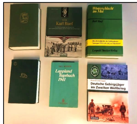
Figur 11: Et utvalg av memoarer med bruk av «jegergrønn».