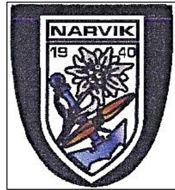
Figur 3: 3. bergjegerdivisjons divisjonsinsignium.

Sitatet illustrerer ikke bare hvordan Wehrmacht forstod 2. og 3. bergjegerdivisjon som «østerrikske» divisjoner, men også hvordan kampene i Narvik ble tilskrevet en viktighet som strakk seg utover interne forhold hos bergjegerne. Bergjegerne blir i radiogrammet beskrevet som «beste representanter», noe som understreker bergjegerens status som forbilledlige innenfor Wehrmacht-systemet i sin helhet. Wehrmacht videreførte også denne propageringen i andre former, som i den militære utmerkelsen, Narvik-skjoldet, gitt til soldatene som deltok i kampene, og i den senere bruken av skjoldet som divisjonsinsignium for 3. bergjegerdivisjon (fig. 3). Narvik ble slik grunnlaget for myten spunnet rundt Dietl og bergjegerne av det nasjonalsosialistiske propagandaapparatet, adaptert og videreført av bergjegerne selv.