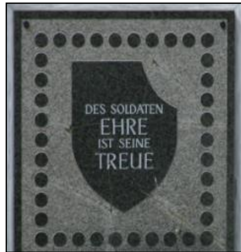
Figur 9: Minnetavle ved Ulrichsberg over SS-soldater: Foto: AK gegen den Kärntner Konsens

Ved minnestedene feiret og feirer veteranene et fellesskap som bevarte kameratskapet og korpsånden fra krigen, men som også fornektet krigsforbrytelser og forherlige frontinnsatsen. Som hos andre militære avdelinger foregikk denne tradisjonspleien innenfor rammene av Wehrmacht-myten, men der andre ble kritisk undersøkt, unndro bergjegerne seg granskning i tråd med 1950-tallets konstruksjon av dem som apolitiske elitesoldater med røtter i en alpin kultur. Først på tidlig 2000-tall etablertes en grundig kritikk av bergjegernes tradisjoner, utfordret av aktivister og grasrotbevegelser som Arbeitsgruppe Angreifbare Traditionspflege (Arbeidsgruppe angrepsbar tradisjonspleie). 362 Navnet på gruppen spiller på den bayerske ministerpresidenten og bergjegerveteranen Edmund Stoibers karakteristikk fra 2001 av bergjegernes tradisjonspleie som «uangripelig», noe som illustrer tradisjonens videreføring også inn i 2000-tallet. 363