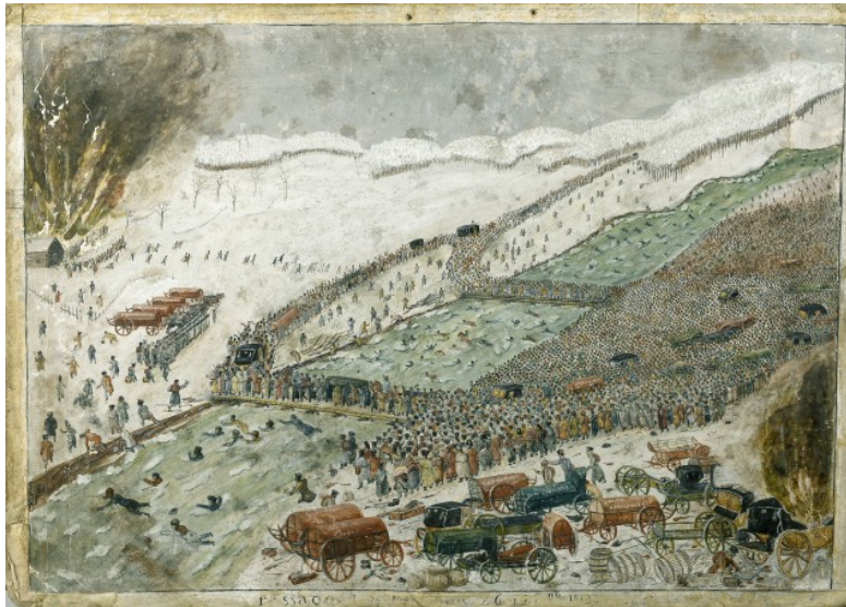
(Figur 2: Ukjent kunstner, Første halvdel av 1800 – tallet. Bildet viser de to broene som ble satt opp og personer som krysser Berezina.)

10.000 «stragglers» eller skadde som da ble raskt angrepet av russiske styrker. Flere gjorde et desperat forsøk på å løpe via de brennende broene eller svømme over, men deres liv gikk tapt ved et slikt forsøk.