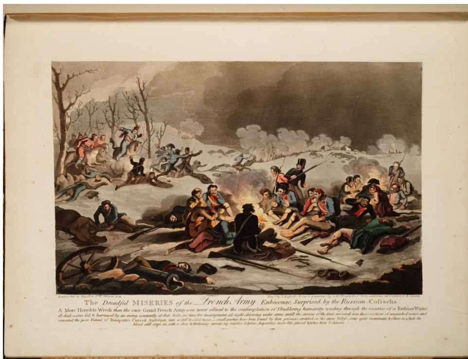
(Figur 1: Writght, 1813. Maleriet illustrerer et angrep fra kosakkene)

Noe som ble et kritisk problem for Napoleon sin infrastruktur og logistikk var Kosakkene sin forstyrrende og effektive krigsteknikk. Kosakkene var lette kavalerister som hadde en særegen teknikk om å terge og provosere fienden sin med korte og raske stikk i stedet for å gå til åpen strid. Majoriteten av soldatene i denne enheten var innfødte «kasakhere» fra Ukraina, Don- og Kuban-området. 52 Deres kampteknikk var ekstremt effektivt når det kom til å bringe kaos over forsynings-linjene og kommunikasjons strekningene. Så med dette er det en mulighet til å tenke over konsekvensene av Napoleon sin kampanje inn i Russland som strak seg på et punkt til 1.000 km, dette kan ha skapt mange muligheter for Kosakkene for å skape kaos og usikkerhet.