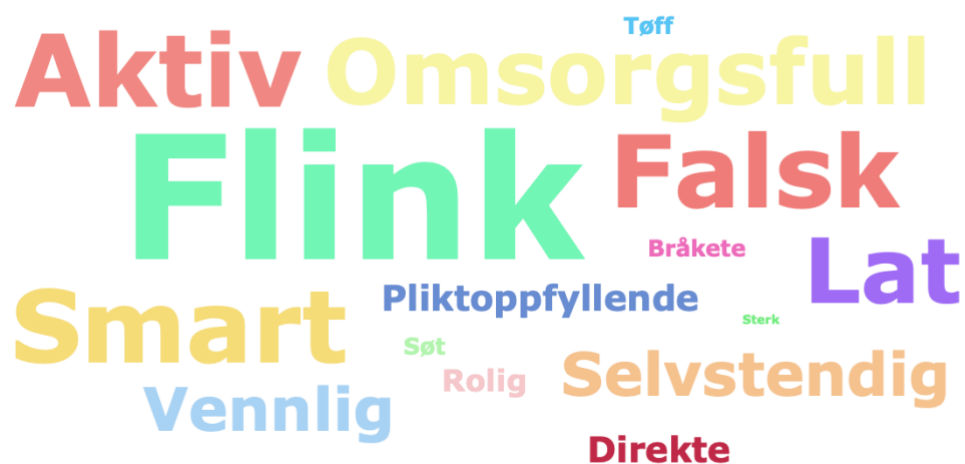
Figur 4.9 Guttene om kategorien Begge/Vet ikke :

Som vi ser av ordskyen over er denne ganske lik ordskyen fra jentenes svar i kategorien. Hovedforskjellene på jentenes og guttenes ordsky til denne kategorien er at guttene har plassert ordet flink flest ganger i denne kategorien mens jente har plassert ordene smart og aktiv mest. Vi kan også se at det er flere gutter enn jenter som har plassert ordet omsorgsfull i denne kategorien. De fleste jentene plasserte dette ordet i kategorien jente . I likhet med jentenes ordsky for denne kategorien er alle ordene med. De ordene som kommer mest fram av guttenes svar i denne kategorien er flinkt , smart , aktiv , omsorgsfull , falsk og lat . Ordene vennlig og selvstendig er også mye nevnt her og kommer bedre fram i denne ordskyen enn de gjorde i jentenes. Det er likevel en liten størrelsesforskjell på disse ordene og på de ordene som er mest fremtredende og de når derfor ikke helt opp.