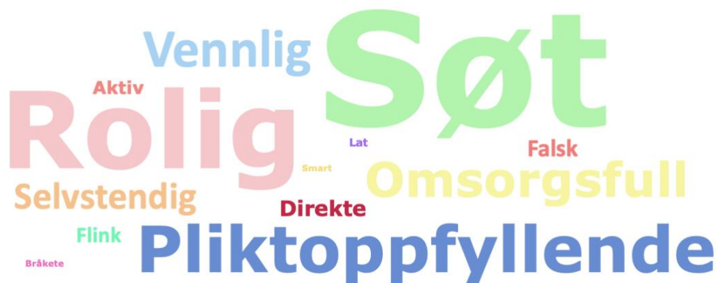
Figur 4.7 Guttenes svar på kategorien Jente :

Ordet søt er det som kommer tydeligst fram her, men ordet rolig er også her plassert mye. Guttene har også plassert ordene pliktoppfyllende , vennlig og omsorgsfull mye i denne kategorien. Ordene som er plassert minst i denne kategorien og derfor ikke er så synlige er bråkete , lat og smart . Ordene tøff og sterk er som vi så av ordskyen til denne kategorien tidligere under de samlede elevsvarene ikke til stede. Men i motsetning til jentenes svar i denne kategorien hvor ordet lat heller ikke var plassert her, er dette ordet med i denne ordskyen. Det er likefullt de samme ordene her som i ordskyen for jentenes svar og i ordskyen for de samlede svarene disse ordene som blir brukt mest til å beskrive kategorien jente . Søt , rolig , og pliktoppfyllende . Hovedforskjellen mellom jentenes og guttenes svar i denne kategorien er at omsorgsfull ikke får like stor plass og blir derfor ikke med som et av ordene som samlet sett beskriver kategorien ut ifra guttenes svar.