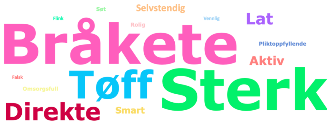
Figur 4.2 Samlede svar på kategorien Gutt :

I denne ordskyen ser vi at det er ordene bråkete og sterk som kommer tydeligst fram når man ser på hva hele elevgruppen samlet sett har plassert på kategorien gutt . Ordene tøff og direkte er også ord som er plassert mye i denne kategorien. Vi kan se at alle ordene dukker opp i denne ordskyen i motsetning til ordskyen for kategorien jente der ordene sterk og tøff ikke var plassert en eneste gang. Vi kan likevel se at de fleste ordene i denne ordskyen er liten i størrelse som indikerer at de bare har blitt plassert i denne kategorien noen få ganger. Samlet sett kan vi si ut ifra denne ordskyen at elevene bruker ordene bråkete , sterk , direkte og tøff for å beskrive kategorien gutt .