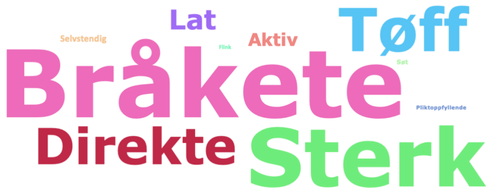
Figur 4.5 Jentenes svar på kategorien Gutt :

Det ordet som flest jenter har plassert i denne kategorien er ordet bråkete . Ordene tøff, sterk og direkte kommer også tydelig fram i denne ordskyen. Vi ser også at et par av jentene har plassert ordene flink, søt, pliktoppfyllende og selvstendig i kategorien gutt . Disse ordene er så vidt synlige i denne ordskyen, størrelsesforholdet mellom disse ordgruppene er altså så markant at det er tydelig hvilke ord jentene mener hører hjemme i denne kategorien. I ordskyen av kategorien gutt som var basert på alle elevsvarene var alle ordene til stede. I denne ordskyen er det en del ord som mangler. Ingen av jentene har plassert ordene falsk, smart, omsorgsfull, rolig eller vennlig i denne kategorien. Videre er ordene søv, pliktoppfyllende, flink og selvstendig nesten ikke synlig i denne ordskyen. Ordene flest jenter bruker for å beskrive kategorien gutt er derfor bråkete, sterk, tøff og direkte .