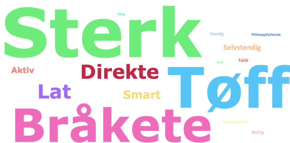
Figur 4.8 Guttenes svar på kategorien Gutt :

Sterk er det ordet som er plassert flest ganger av guttene i denne kategorien. Tøff og bråkete er også ord som de fleste av guttene har plassert under gutt . I likhet med