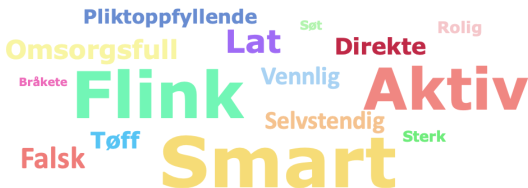
Figur 4.3 Samlede svar på kategorien Begge/Vet ikke :

Som vi ser av ordskyen til elevgruppens samlede svar i kategorien begge/vet ikke er det en mye større spredning av ord i denne kategorien enn vi kunne se at det var i kategoriene gutt og jente . Ordene som utmerker seg mest i denne kategorien er smart , flink og aktiv . I likhet med kategorien gutt er alle ordene som skulle plasseres også nevnt her. Det ligger likevel en vesentlig forskjell i antall ganger ordene er nevnt og det er derfor et mye større likhetsforhold mellom ordene i denne kategorien. Samlet sett er fordelingen av ordene i denne kategorien så jevn at jeg ikke vil peke ut noen ord som elevene bruker for å beskrive kategorien begge/vet ikke .