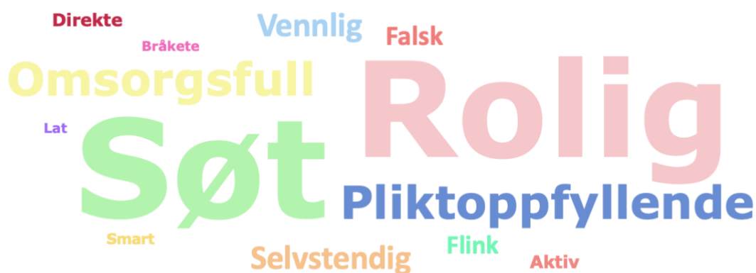
Figur 4.1 Samlede svar på kategorien Jente :

Som vi ser av ordskyen over er det ordene søt og rolig som er plassert flest ganger i kategorien jente av den samlede elevgruppen. Omsorgsfull og pliktoppfyllende er også ord som er plassert mye i denne kategorien. Ordene sterk og tøff er ikke plassert i denne kategorien i det hele tatt. Bråkete , lat , smart og aktiv er ord som bare er plassert i denne kategorien et par ganger, og kommer derfor fram som veldig små i størrelsen i ordskyen. De resterende ordene er nevnt en god del ganger, men kommer likevel ganske langt bak de ordene som er nevnt her flest ganger. Av denne ordskyen kan vi si at elevgruppen samlet sett bruker ordene rolig , søt , omsorgsfull og pliktoppfyllende for å beskrive kategorien jente .