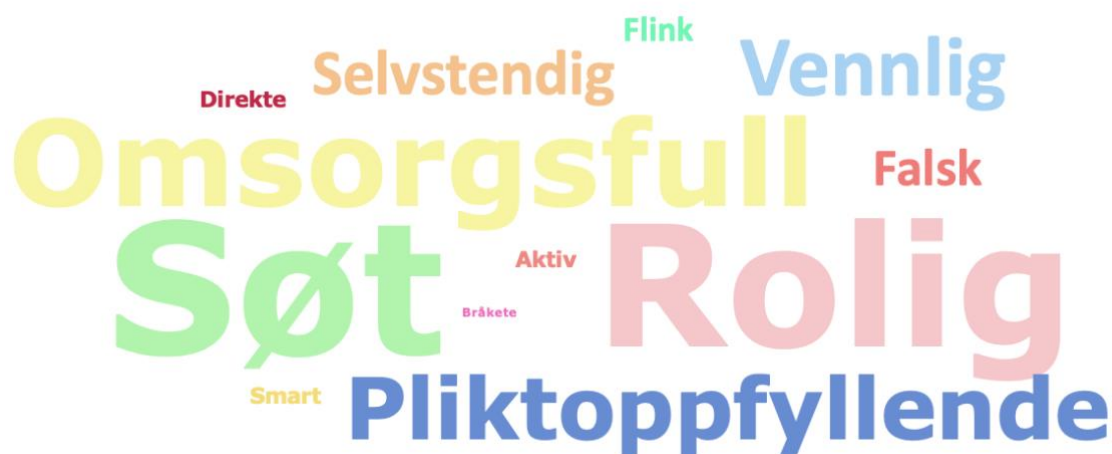
Figur 4.4 Jentenes svar på kategorien Jente :

I likhet med den samlede ordskyen for kategorien jente , har også mange av jentene plassert ordene søt og rolig i denne kategorien. Omsorgsfull er et ord som kommer bedre fram i jentenes svar på kategorien jente enn det gjorde i den samlede ordskyen til denne kategorien. Vi kan også se at ordet lat som var til stede i den samlede ordskyen av kategorien jente ikke er til stede i ordskyen som er laget av jentenes svar på denne kategorien. Ordene vennlig og selvstendig er også ganske tydelige i denne ordskyen. Bråkete derimot er så vidt synlig. De resterende ordene er lesbare men ikke fremtredende i ordskyen. De ordene som kommer mest fram og som derfor representerer jentenes samlede syn på kategorien jente er de samme ordene som kom