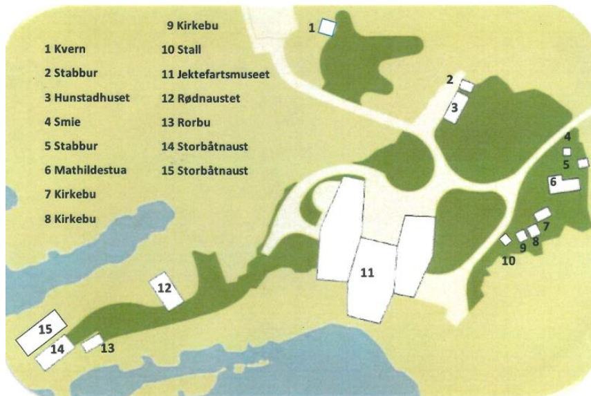
De 15 byggingene (med Jektefartsmuseet) i Bodøsjøen friluftsmuseum. Illustrasjon: Bodøsjøen friluftsmuseum brosjyre (Nordlandsmuseet).

Nordvest i Saltfjorden i Bodø finner man Bodøsjøen. Denne bydelen har de siste årene vært sentral i en større vekst man ser i hele lokalområdet, og bydelen har også en lang og viktig historie knyttet til den lokale kystkulturen i Salten. Et aspekt som reflekterer denne rike kysthistorien, er Bodøsjøen friluftsmuseum. Dette friluftsmuseet samler 14 bygg fra rundt om i Salten. Her finner man blant annet naust, hus, stabbur og buer. Siden 2019 har derimot et annet bygg etablert seg i