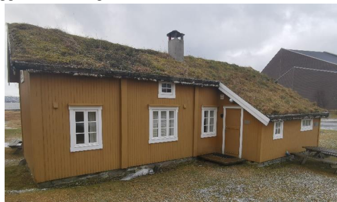
Mathildestua slik den står i dag.

I årboken til Nordlandsmuseet fra 1989 blir Mathildestua beskrevet som «...hjerte i anlegget», 34 en interessant kontrast til dagens friluftsmuseum, hvor fokuset til Mathildestua har blitt nokså tilsidesatt for å gi fokus og plass til Jektefartsmuseet. Mathildestua blir i dag fortsatt brukt av både Nordlandsmuseet og