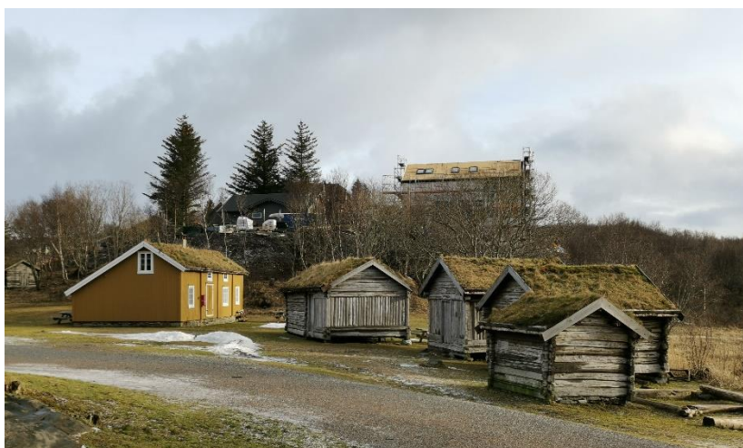
Fem av byggene i Bodøsjøen friluftsmuseum: Mathildestua sammen med 3 kirkebuer fra Rognan og en stall fra Saltdal.

På starten av 80-tallet så man i tillegg også en interessant utvikling av Anna Karoline. Frem til 1979 var nemlig Anna Karoline fortsatt utstilt under åpen himmel der den eneste formen for beskyttelse var med det kjemiske (og giftige) stoffet pentaklorfenol. 27 Nordlandsmuseet var ikke bestemt på at Anna Karoline skulle forbli i Bodøsjøen, men basert på den truende utviklingen av sopp og restaureringsbehovet ble det bestemt å bygge et midlertidig bygg rundt henne. 28 Selv etter flere forsøk og planer forble Anna Karoline omringet av dette bygget frem til byggingen av Jektefartsmusset startet i 2017. 29