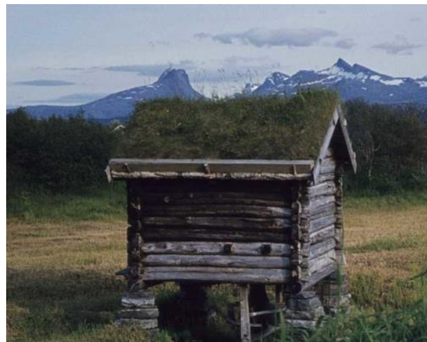
Kverna fra Steigen etter restaureringen i 1989.

Kverna fra Steigen ble restaurert i 1989. Da ble en tredjedel av tømmeret skiftet ut i tillegg til utskifting av deler av taket og vindskier. 45 I dag er det vanskelig å se sporene fra denne restaureringen. Det eneste hintet man kan se av endringer er gjennom gråskjæret i fargen på det nyere tømret. Dette er tydelig visuelt autentisk med tanke på at byggets karakter og oppfatning som en kvern fra 1600-1700-tallet ble opprettholdt, da i dette tilfellet i bytte mot materialautentisitet. Interessant nok hvis man ser på to andre bygg kan man også se likheter hvor visuell