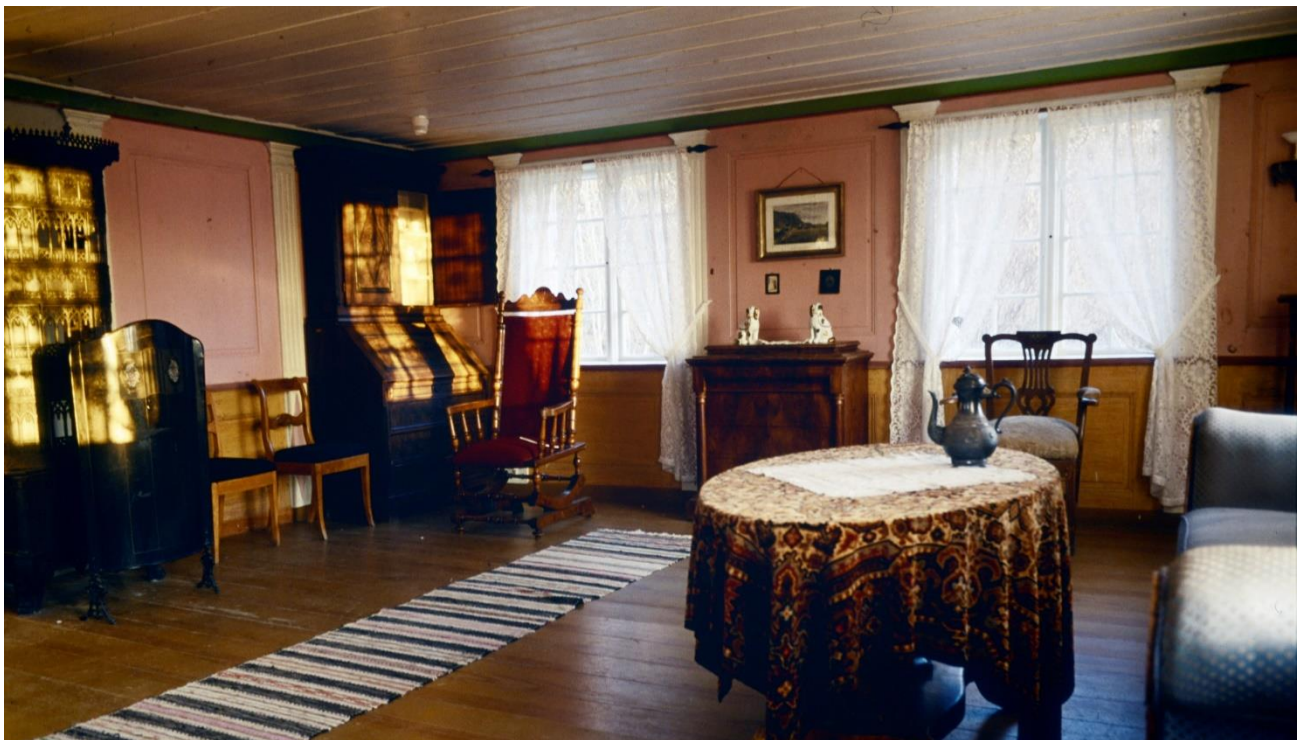
Figur 3 og 4 (neste side): Bildene viser nystua fra hver side av rommet. Her er stolene som skal stå rundt bordet satt langs veggene, eller samsvarer bildene med utstillingskartet fra 1981. Stua er for det meste innredet tidsriktig, bortsett fra gyngestolen som er fra cirka 1820-tallet.

På veggen mot kjøkkenet og gangen ble det i hvert hjørne satt inn skap som fungerte som oppbevaring av finserviset samt for kaffekanner og karafler. Stua ble møblert med en grønn sofa og et mørkebrunt kaffebord med tre stoler rundt. Langs veggene i rommet ble det satt til sammen fem stoler. På bordet var det en duk med en brikke i midten som en kanne sto på. Kortveggen ved døra var innredet med et kråskap, ved siden var det plassert en gyngestol og en kommode med pyntegjenstander. I hjørnet var det en pyntehylle og et bord med sysaker. Fordi vinduer er parallelle i trønderlån ble også en del møbler plassert parallelt. På motsatt vegg var det også satt en kommode med pyntegjenstander slik som på veggen ved døra. I hjørnet på denne veggen er det også plassert en pyntehylle. Ved veggen mot kjøkkenet sto det en Amerika-gyngestol mellom skatollet i hjørnet og ovnen, og ved døra sto det en vedkasse. På gulvet lå det to lange tepper, slik det også hadde gjort da Klæt-familien bodde der. 39