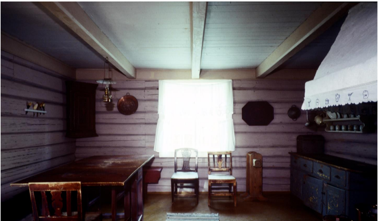
Figur 6: Bilde tatt av kjøkkenet fra gangen. Til venstre henger hornskjeene på veggen.