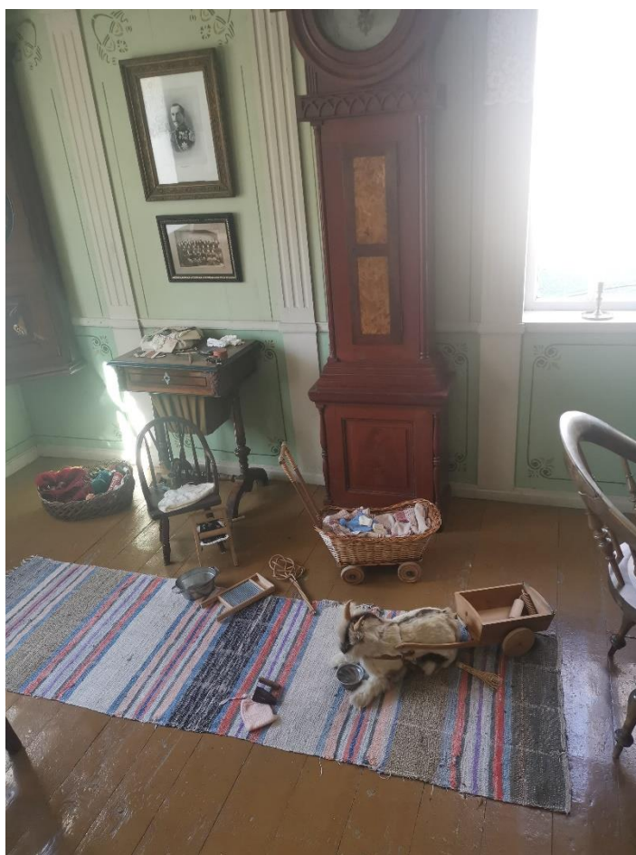
Figur 14: Barnas nærvær tydeliggjøres blant annet gjennom lekene på gulvet i dagligstua.

har ikke blitt satt inn noe nytt for å erstatte det som ble tatt ut. 62 En viktig del av den nye miljøutstillingen er derfor tydeliggjøringen av barnas nærvær. Dette er blant annet gjort ved å plassere gjenstander som barn har en relasjon til i utstillingen. Det er for eksempel leker på gulvet i dagligstua, det står en barnestol med skinnfell ved stuebordet og en barnehuske/stol som henger ned fra taket inne på kjøkkenet. Samtidig som kontrast er det ingen spor av barna i nystua. Denne tydeliggjøringen av barnas nærvær er gjort både for å engasjere barna som kommer til museet og, for at museet via gjenstandene kan formidle barns hverdag i 1910. 63 I tillegg til at dette har vært viktig for å engasjere de yngre generasjonene så bidrar det til illusjonen om husfolket som bor her.