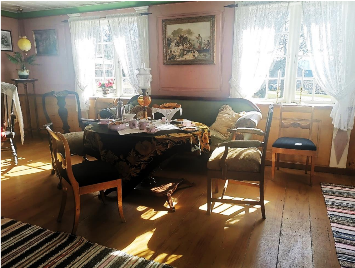
Figur 10: Bordet i nystua er dekket på til besøk.