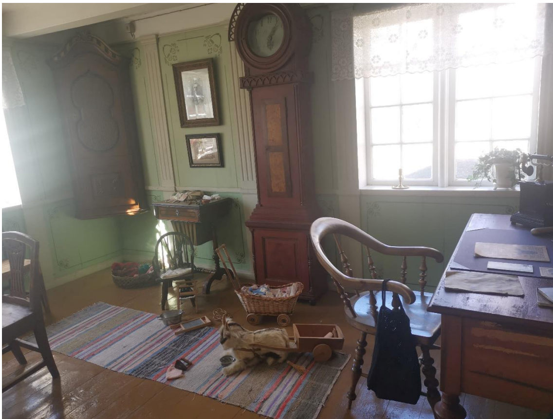
Figur 11: bildet viser skrivebordet i dagligstua og lekene til barna.