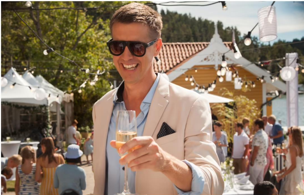
PARTYGUTT: Pål Sverre hagen spiller William, en av rollefigurene det svinger voldsomt for gjennom serien.