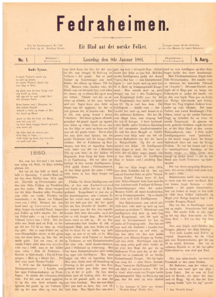
Bilde 2: Fedraheimen utkom i ny og modernisert drakt fra og med 1881-årgangen. Her sees Garborgs oppsummeringsartikkel om de viktigste begivenhetene fra året som har gått.

Dette understreker Garborg ettertrykkelig ved å skrive at det hverken var svensker eller dansker som ville oss vondt denne gangen. Videre skrives det følgende om fienden det ble kjempet mot i 1880: «Det same Partiet, som hatad Bondemagti i politikken, hatad og det norske Nationalflagg og Arbeidet for å reisa eit norskt Tungemaal. Ja gjennom sin øvste politiske Ordførar sagde det ende ut, at det ikkje likad, at den norske Nationalkjensla vaks». 221 Partibegrepet brukes altså som den primære samlebetegnelse på den andre nasjonaliteten i innledningsartikkelen for 1881-årgangen, noe vi har sett har vært dominerende siden dekingen av valgkampen i 1879.