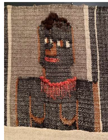
Rygg, Hannah. Etiopia. 1935. Billedvev. 160 cm x 380 cm. Nordenfjeldske Kunstindustrimuseum.

I de siste årene har man sett en kulturell økning i intoleranse for rasisme i samfunnet. Utløst av Black Lives Matter-bevegelsen i 2020 har offentlige reaksjoner på rase-motiverte handlinger blitt satt i fokus. Denne kulturendringen har gjort at man er var for diskriminerende og rasistiske avbildninger i kunst, kultur, film og tv. Med dette i tankene er Hauglids tolkning, en tidsriktig reaksjon. Han beskriver to av figurene som forvrengte avbildninger som er både sjokkerende og groteske. Hauglids tolkning viser hvordan man i ettertid kan se på historien med et mer kritisk syn. Ikke bare med de opprørene man har sett i nyere tid, men også hvordan man historisk har sett ned på flere folkegrupper. Han mener han ser antydninger til nazismens holdninger til jøder og de med mørkhudfarge. De holdningene som hører hjemme i «den europeiske fantasi mørke kjeller», og med dette leter han etter en advarsel i verksetiketten. Han leter etter en forklaring på hvorfor man hyller kunst som er «menneskefiendtlig», når dette er en tid for å se forbi utdaterte holdninger.