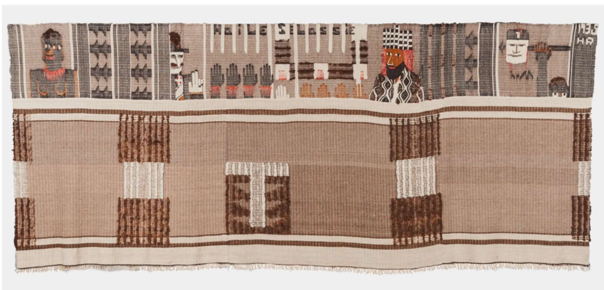
Ryggen, Hannah. Etiopia. 1935. Billedvev. 160 cm x 380 cm. Nordenfjeldske Kunstindustrimuseum. https://digitaltmuseum.no/021045849228/etiopia-billedvev