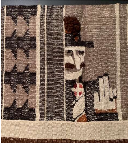
Rygggen, Hannah. Etiopia . 1935. Billedvev. 160 cm x 380 cm. Nordenfjeldske Kunstindustrimuseum.

avbildningen ikke er en korrekt representasjon. Museet skaper en fortelling rundt verkets betydning som ikke forteller hele historien. I den forstand er det viktig at etiketten utforsker flere aspekter ved verkets betydning, noe Hauglid kanskje antyder at det mangler med «Etiopia».