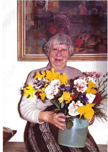
Ryggen, Hannah. Hannah etter sin 75-årsdag. 21. mars 1969. Nordenfjeldske Kunstindustrimuseum.