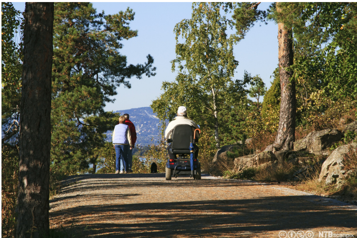
Figur 4: Illustrasjon av universelt utformet turveg. Fotograf Svein Grønvold. Scanpix.no[2]

UU er en strategi som brukes for at flest mulig skal kunne bruke transportsystemet vårt på en likestilt måte. På denne måten øker man likestillingen i bruken, og kvalitetene som legges inn i transportsystemene tilfaller flest mulig slik at flest mulig blir ivaretatt.