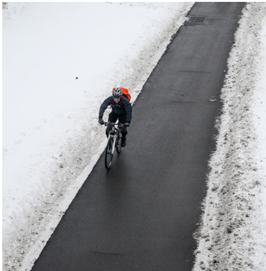
Figur 2: Barvegsstandard GsA.[9]