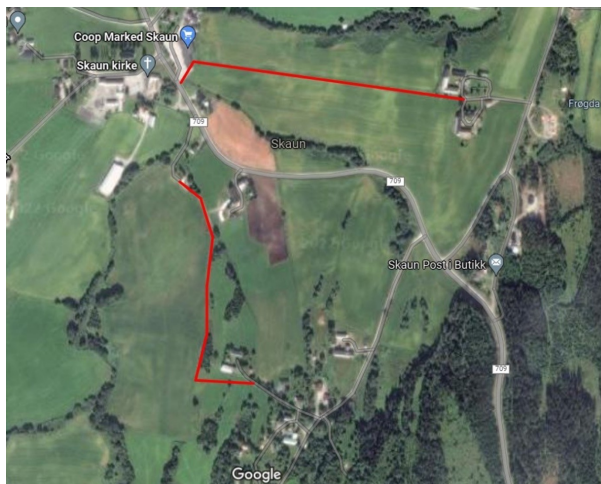
Figur 1: Oversikt snarvegernes plassering i forhold til Venn sentrum.

Skaun kommune betaler årlig over 800 000 kroner for sikker skoleskyss til ti av sine skoleelever. Dette er en stor kostnad med tanke på kommunens størrelse og det er derfor ønskelig å utarbeide en Nytte- kostnadsanalyse (NKA) for utbygging av gang- og sykkelveger/snarveger i området rundt Venn i Skaun. Hensikten med utbyggingen er å redusere eller fjerne behovet for sikker skoleskyss til elevene. Dette er en fin mulighet til å løse et reelt problem som Skaun kommune har og lære mer om både prosjektering og samfunnsøkonomi.