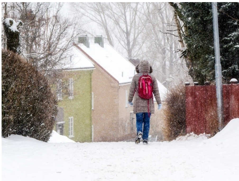
Figur 3: Blandingsstandard GsB. Foto: Knut Opeide, Statens vegvesen[9]