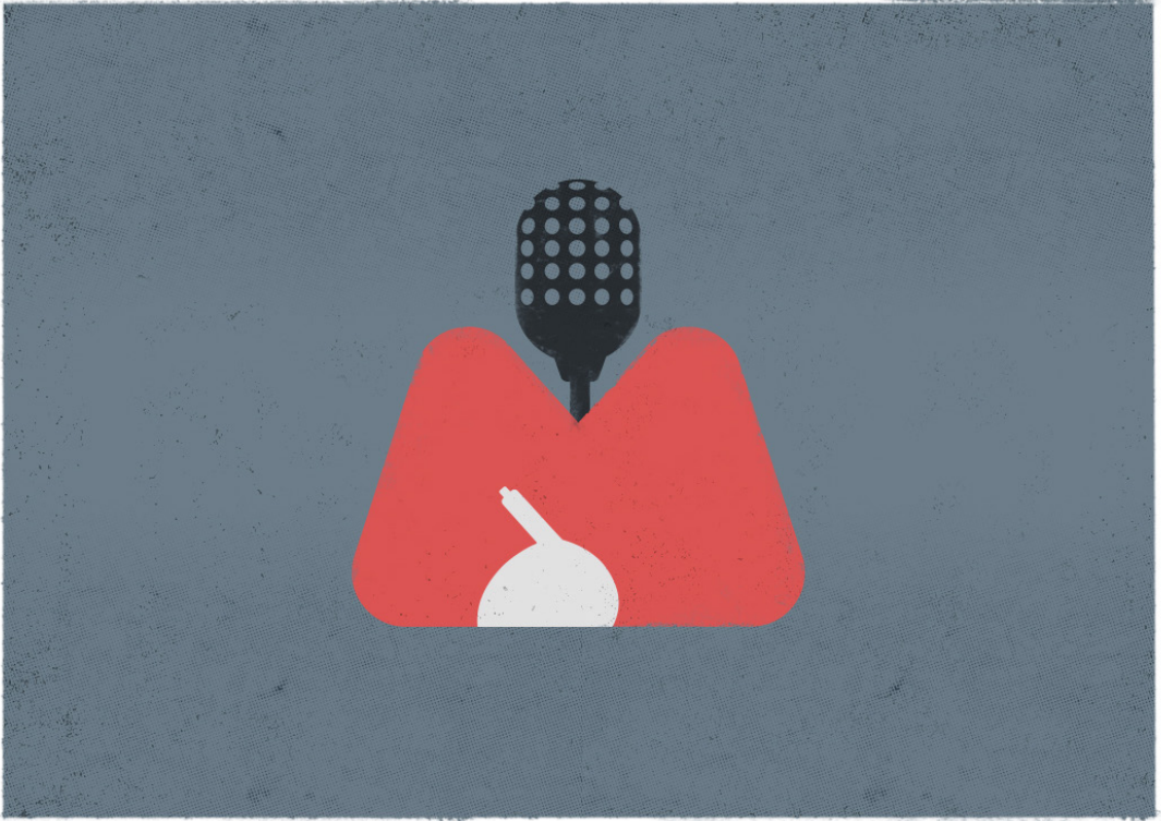
Forlot pressen sin rolle som mikrofonstativ for partiene i denne perioden? (Ill: Endre Barstad © 2019).

hadde fått betydelige driftsproblemer. 133 For det fjerde, høyrepressen eksisterte ikke bare som en overordnet partipresseorganisasjon, men også som en organisatorisk realitet i enkeltaviser. Vi har påvist at den i høy grad eksisterte i de seks orklaoppkjøpte avisene i 1985/86.