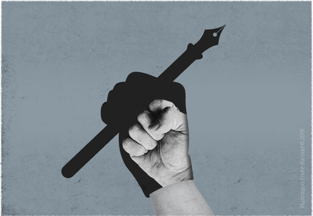
Offentlige utredninger viser at pressen oftest fungerte som redskap for politikernes egne fortellinger, hevder forfatterne.

ning til aviser» 34 på ulike måter. Bare partiet Høyre var på det tidspunktet motstandere av pressestøtten, men motstanden avtok utover 1970-årene.