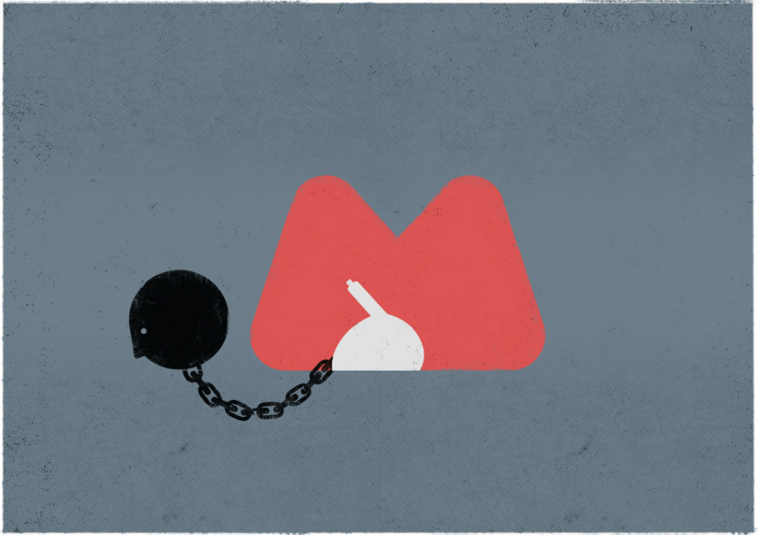
I tiårene før pressestøtteordningen ble etablert, var bindingene mellom partiene og mange aviser sterk.