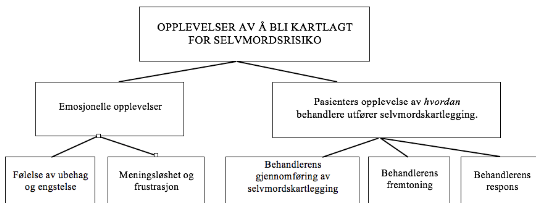
Figur 2. Hovedtemaet «Opplevelser av å bli kartlagt for selvmordsrisiko» med sine respektive undertemaer.